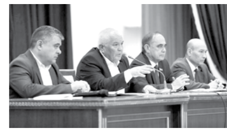
Нурафшон шаҳрида Фуқаролар йиғинлари раислари (оқсоқоллари) сайловининг ташкилий-ҳуқуқий асослари-га бағишланган амалий семинар бўлиб ўтди.