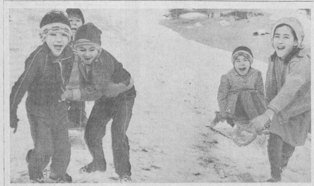
КУМУШ ҚОРНИНГ ЗИЙНАТИ

Кинотомошабинларга кино хизмати кўрсатиш адолатини яхшилаш, юксалтириш билан болани тақлиф ва исталар юзасидан Тошкент шаҳар ижроия комитетининг Бош маданият бошқармаси 33-37-11 телефони бўйича қўнроқ қилинсин.