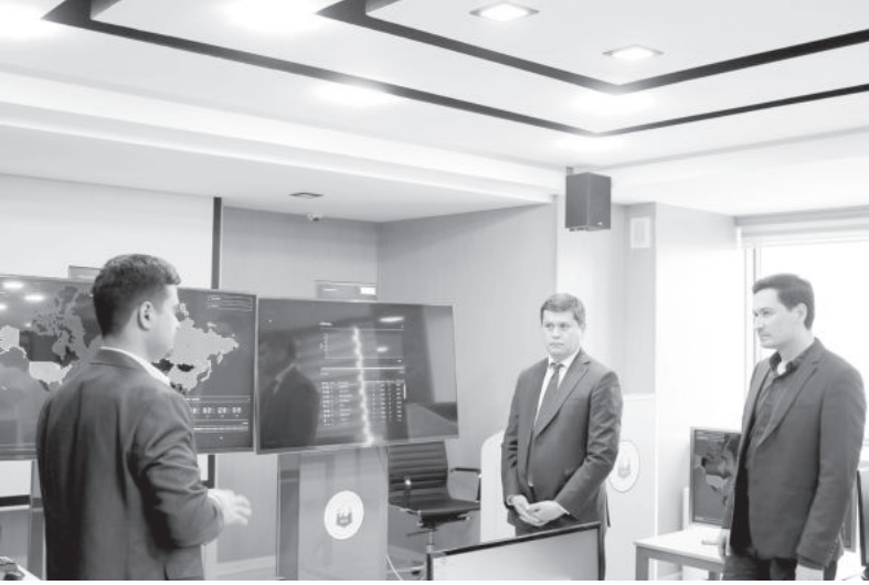
◀ (Окончание. Начало на 1-й стр.)

Сегодня весь мир сталкивается с киберпреступностью, финансовым мошенничеством, компьютерными атаками. По данным Всемирного экономического форума, в 2018 году ущерб мировой экономике от киберпреступности составил 1,5 трлн долларов, в 2022-м прогнозируются потери в восемь трлн, а в 2030-м они могут достигнуть 90 трлн. Это еще раз подтверждает тот факт, что совершенствование информационной и кибербезопасности - актуальная проблема современности.