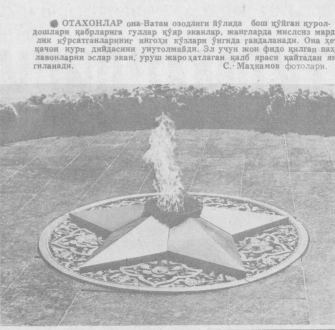
● ОТАХОНЛАР ана-Ватан овозлиги йўлида бош қўйган курашда қабрларига гуллар қўйиб эканлар, жангларда миссия мардик кўрсатганларнинг илҳом қўлари йўлида гавдаланади. Она ҳеч қачон кури дийдасини унголмайди. Эл учун жон фидо қилган нахлавонларни эслар экан, уруш жароҳатлаган қабр яраси қайтадан янгиланади.

Гага ва Женевада илгари бўлиб ўтган ҳарбий асирларга муносабат тўғрисидаги халқаро-ҳўқуқ битимларига ҳилоф равишда гитлерчилар асирларга нисбатан ваҳшийларча муносабатда бўлишини олдиндан режалаш қўйган эдилар. 1941 йилнинг июлида «комиссарлар тўғрисида буйруқ» деб номланган буйруқ чикарилди. Унда комиссарларни аўдик билан аяратиш ва уларни