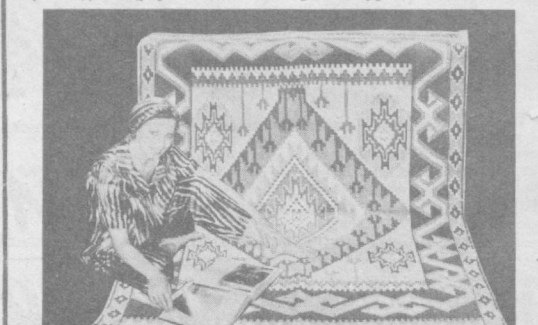
«ЎЗМЕСТПРОМ» ИЛМИЙ-ИШЛАБ ЧИҚАРИШ БИРЛАШМАСИ (телефон 76-47-11).

Асрлар оша тақомиллашиб қолган гиламлар бугунга келиб, жиҳвали гули, бўғининг ёрқинлиги билан кишилар диққатини жалб этиб келмоқда. Гиламлар уйнинг ҳуснига ҳусн қўшади, файз ва тароват киритади. «ЎЗМЕСТПРОМ» ИШЛАБ ЧИҚАРИШ БИРЛАШМАСИ КОРХОНАЛАРИНИНГ ГИЛАМЛАРИ замонавий мода талабларини ҳисобга олган ҳолда халқ ижодиётининг энг яхши анъаналари асосида ишлаб чиқаришмоқда. Улар пишиқ тўқилганлиги ва бўғининг жозибаси, ёрқин бадний ҳусунияти билан ажралиб туради.