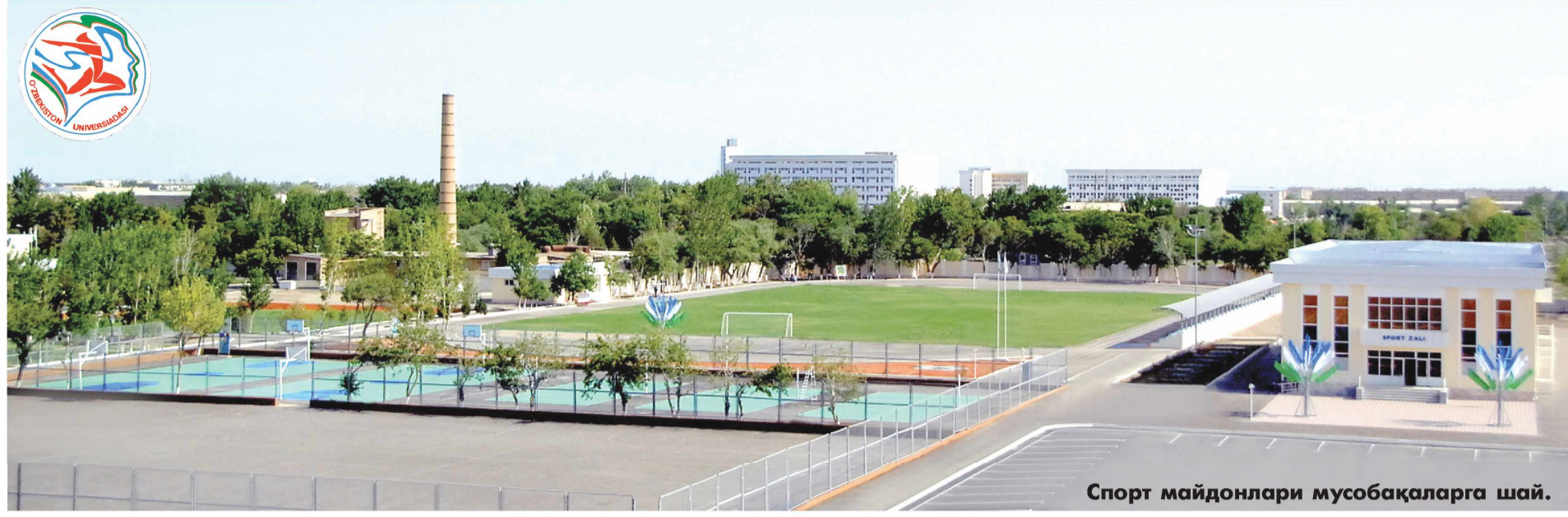
Спорт майдонлари мусобақаларга шай.

Дарҳақиқат, бугун ёшларимизнинг дунёда ҳеч қандам кам бўлмаган юртимизда, Олимпия ўйинларида Ватанимиз шухратига шухрат қўшаётгани фикримиз тасдиғидир. Камолот ва гўзаллик, ёшлар ва шижоат байрамига Бухоро вилояти иккинчи мартаба мезбонлик қилмоқда.