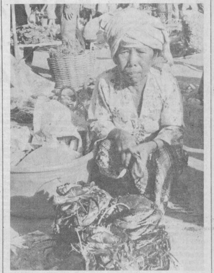
Малайзия Федерацияси Жануби-Шарқий Осиёда жойлашган бўлиб, Малакка ярми оролининг жанубини ва Калимантан оролининг шимолий қисмини эгаллайди.

Малайзия ўз тараққиётида мустақиллик учун курашининг машаққатли йўлини босиб ўтди. У аввалига Португалия, сўнгра — Голландия, 1824 йилдан бошлаб эса Англия зулмини бошдан кечирди.