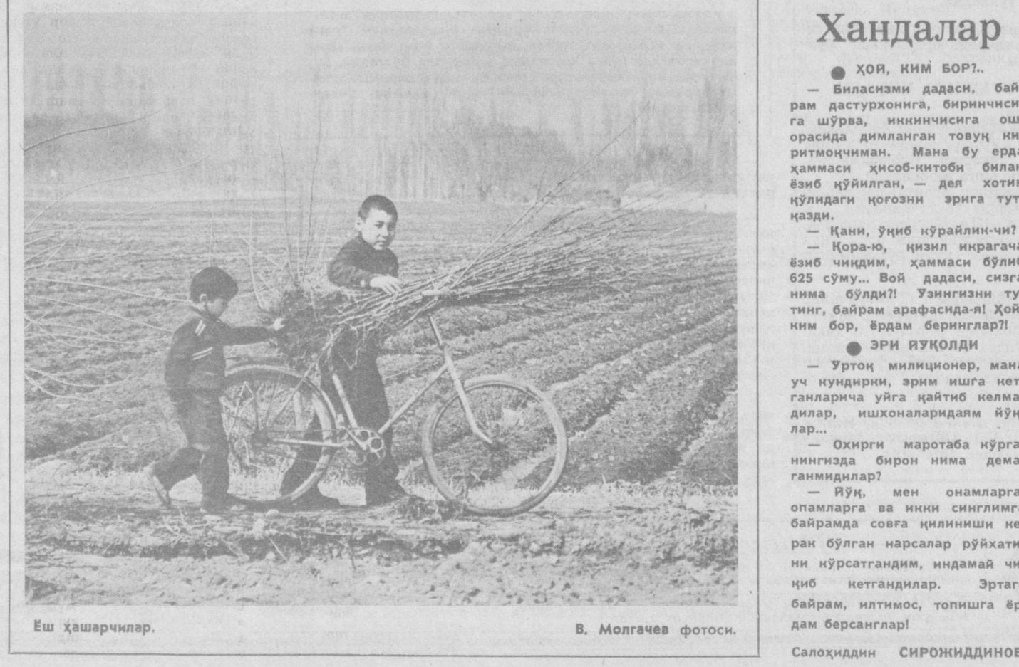
Ёш ҳашарчилар.