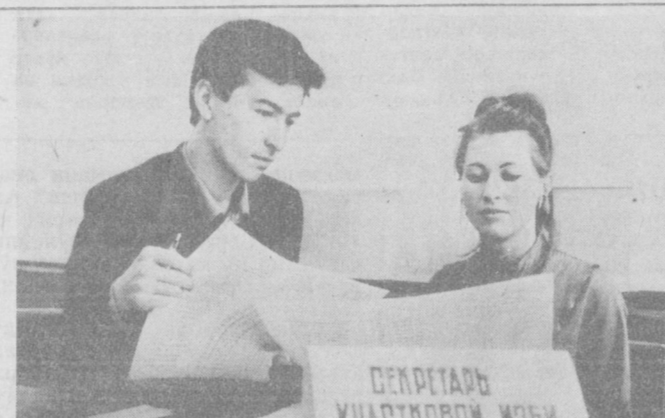
Киров районидagi 1-музыка мактаби биносида 1/52-сайлов участкаси жойлашган. Ҳозир бу ерда иш жуда қизғин. Учасна сайлов комиссияси ҳузурига турли масалалар юзасидан маслаҳат сўраб келаётганлар кўп. 20 нафар пропагандист сайловчиларнинг барча саволларига жавоб бермоқда. Негани, ахборот маркази ҳам шу ерда жойлашган. Бу сайлов участкасида 2 минг сайловчи нуносиб халқ вакилларига ўз овозларини беришади. Биринчи марта овоз берувчи учун махсус стендар ташкил қилинган.

Ҳа, номзод халқимизнинг турмуш даражасини яхшилаш, аҳоли яшайдиган жойлари обод қилиш, маданий-маиший, транспорт, спорт, медицина хизматини йўлга қўйиш ҳақида бош қотирмоқда. Одамлар учун биринчи навбатда зарур муаммоларни ҳал этиш, табиат ва атроф-муҳитнинг мусофоллиги учун курашда жонбозлик кўрсатишни ўз олдига мақсад қилиб қўйган. Уруш ва меҳнат ветеранлари, айниқса хотин-қизлар меҳнати ва дам олиш шартноҳларини ҳозирги талаблар даражасига кўтаришга қўмақлашиб, ёшлар тарбиясига эътибор бериш, тараққиётимизга тўсқинлик қилмаётган ҳар қандай нуқсонларга қарши аёвсиз ўт очин сингари кишиларнинг тили ва дилидаги муаммоларни ҳал этишда куч-гайрати, билими, ташкилотчилик қобилиятини ишга солишни энг муҳим вазифалари деб билади. Шунинг ўзи ҳам номзоднинг халқ ишига бел боғлаганидан далolat бериб турибди.