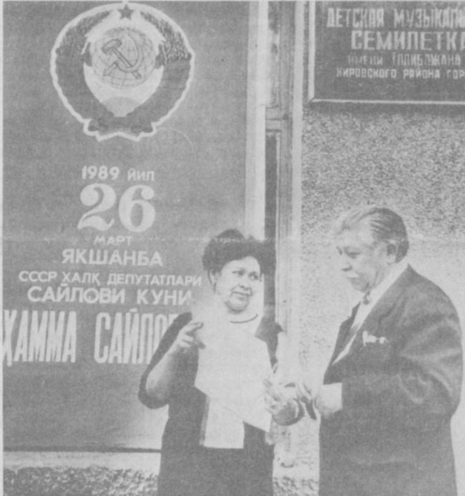
1989 йил 26 март ЯҚШАБда СССР Халқ депутатлари Сайлови куни. ЯММА Сайлов участкаси.

Тошкент шаҳар партия комитетининг бўлажак пленуми олдида