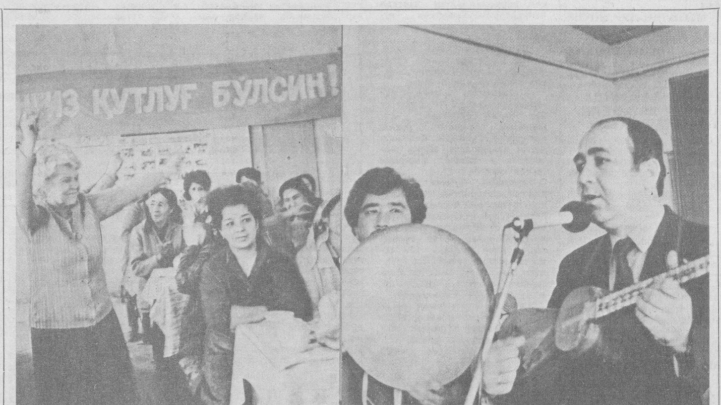
Шаҳримизнинг қай бир маҳалла ёки кварталга борган Наврўз байрами шодиена нишонлаётганининг гувоҳи бўласиз. Киров районидagi Фирдавсий номи маҳалла аҳолиси ҳам бу байрамни кенг нишонлади. Унда маҳалла хотин-қизларига атаб алоҳида кеча ҳам ўтказилди. Райондаги А. Қодирий номи маданият уйининг ҳаваскорлари ранг-баранг концерт программалари билан хўшнуд эттишди. СУРАТЛАРДА: маҳаллада Наврўз байрами.

ликлар тутишади. Ҳамма ерда халқ сайли, ўйин-кулги авжига чиқади. Мен 1975 йил Наврўз вақтида Эронда бўлган эдим. Бу воқеаларнинг гувоҳи бўдим. Урта Осиёда яшовчи халқларда, жумладан Ўзбекистонда ҳам Наврўз худди шу сингари байрам қилинади. Фақат, унга айрим-айрим анъаналар киритилган ҳолос. — Тантаналар қиллоқ жойларда қандай кечади? Ҳозир ҳам шундай бўлармикан? — Қиллоқ жойларда Наврўз ерга қўш солиш билан туғайди. Уни форслар «Жуфт баророн» ёки «Кулба ваши» дейдилар. Икки ҳўкиз қўшилган қўшга қишлоқнинг энг хўрматли оқсоқоли (кексаси) қўшчилик қилиб, биринчи омончи ерга қўлайди. Сўнг оқсоқол ерга бир неча сиқим дон сепади. Уш кини кун ўтгач Наврўзнинг ўн учинчи кунинда дала сайиллари бошланади. Шаҳарликлар болларга, қишлоқликлар даладашларга, тоғ этанларига чиқишади. Қизлар тинч чашма сувларини қўзаларига тўлдириб унга узукларини ташлаб бахтларидан фол очадилар. Наврўзнинг ҳам «Қорбобоси» бор. У — «Бобо деҳқон», у кўк кийинган нуруний чол образида. Наврўзни қандай ўтказиш халқнинг кўнглига боғлиқ. Лекин авваллари юқоридагидек бўлиб келган. — Демак, Наврўз меҳнат, янги кун, янши ниятлар байрами экан-да!