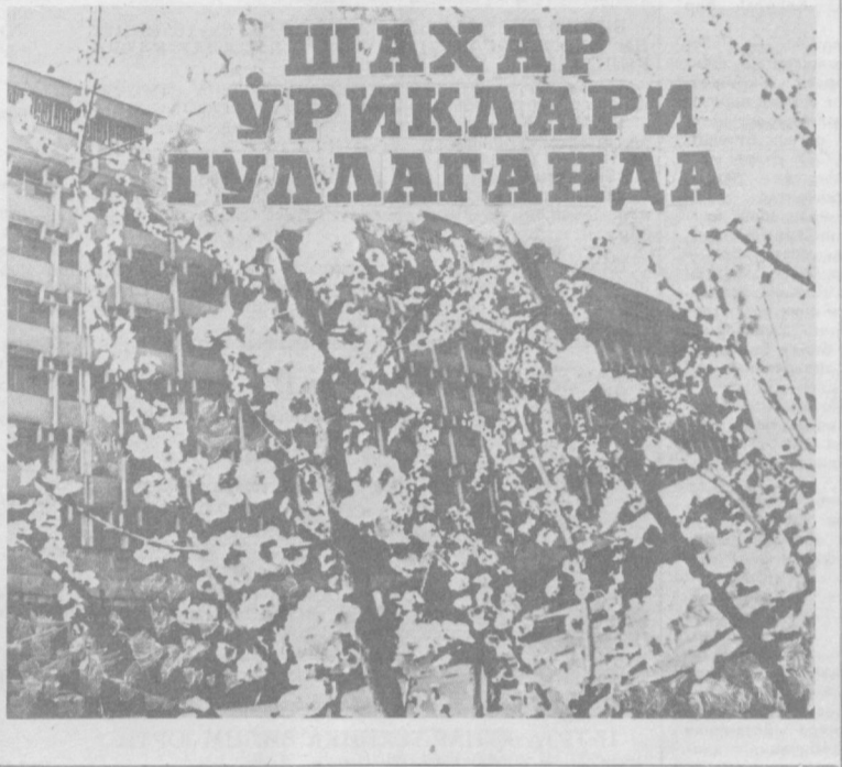
Бундан беш йил муқаддам республика, область, шаҳар матбуотида Дадаҳон Нурийнинг «Шаҳар ўртаклари» мақоласи анча шов-шувга сабаб бўлган, унда кўтарилган масалалар юзасидан қарорлар қабул қилинган эди. Ўшунинг ўзи кўтарган мавзуга қайтиб, редакциямизга ушбу мақоласини тақдим этдим.