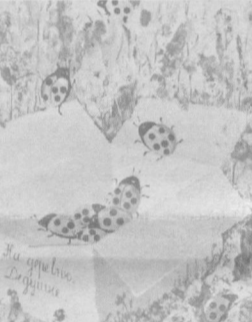
Москвада «Экология-89» пакатаар выставкиси очилди. Шу ерда табият ва инсон ҳақидаги 100 дан зиёд плакатлар, отритикалар, этюдлар, шунингдек табиий материаллардан асалган композициялар намойиш этилмоқда.

Ўзбекистон Электрон са-новати ҳодимлари ишлаб чиқ-қан автоматлаштирилган ком-плек — «Зодиак» система-си ана шу саволга мутлақо аниқ жавоб қайтарди. Тош-кент «Кибернетика» илмий ишлаб чиқариш бирлашма-сининг лойиҳа конструктор-лик боровида катта интег-ралли системалар, микро-процессор комплеклар, мат-рица кристалларнинг ҳо-лати ва ишини ҳам тезда бе-хато текшириш имконини бе-радиган приборлар яратил-ди. Буюртмачилар «Зодиак»-нинг кенг имкониятларига, унинг тез ишлашига, пухта-лигига, арзонлигига қизи-қишмоқда. Система кон-струкцияси модули бўлгани ҳам жуда муқимдир. Уни керакли параметрларда на-талаштириш мумкин. Айни вақтда программани таъ-минот ҳам берилади. «Зо-диак» ўз иши таянчалари-ни бўйиқ берилиши билан ё дисплей экранида, ёки босма қурилда оралиқ маълум қи-лади. У ўзини ўзи текшириш қобилиятини ҳам эга. Дар-ҳол қайд этилган носозлик-ларни ҳам ҳабар қилди. Электр манбада хатарли ўзгариш содир бўлса, у ўзи ҳам назорат объектини ҳам ўчирди. «Кибернетика» бирлаш-маси автомат бошқариш си-стемаси махсус лойиҳа-конструкторлик бюросининг бўлим бошлиғи Л. Кондратьев илмий-ишлаб чиқариш бирлашмаси мазкур ускуна-ларини ишлаб чиқиш билан бирга етказиб ҳам беради. Буюртмага ёнон бу ерда керакли комплектда «Зодиак» системаларининг зарур миқдорини тайёрлаб бериш-лари мумкин, деб айтди. (ЎТАГ муҳбири)