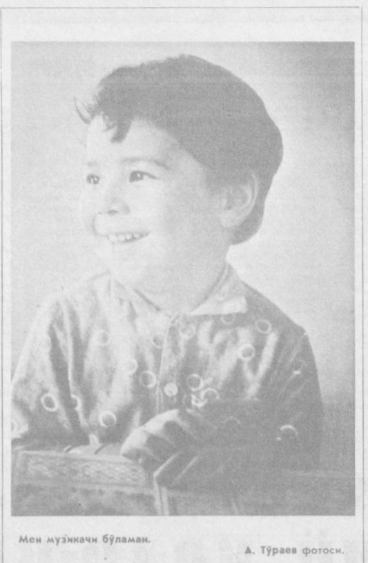
Мен музикачи бўламан.