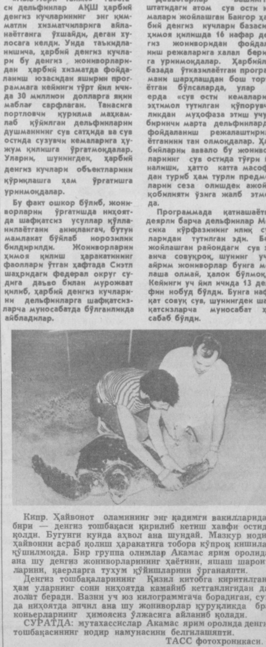
Дельфинлар Вашингтон штатидаги атом сува ости кемалари жойлашган Бангор ҳарбий денгиз қучлари базасини ҳимоя қилишда 16 нафар денгиз жинворидан фойдаланиш режаларига ҳалал беришга уринмоқдалар. Ҳарбийлар базада ўтказилмаган програмани бўлсаларда, улар бу ерда «сува ости кемаларини эҳтимоп тутишга кўпоруқчиликдан муҳофаза этиш учун биринчи марта дельфинлардан фойдаланиш режалаштирилган тани олмақдалар. Ҳарбийлар аввало бу жинворларнинг сува остида тўғри йўналиши, ҳатто катта масофадан туриб ҳам турли предметларни сеза олишдек аjoyиб қобилияти ўзига жалб этмоқда. Программада қатнашаётган дельфинлар дельфинлар Мексика кўрғазининг яқин сувлардан тутилган эди. Биз жойлашган райондаги сува ости атом реактор шунинг учун айрим жинворлар бунга мослаш олимай, ҳалок бўлмоқда. Кейинги ўй ишда 13 дельфин нобуд бўлди. Бунга нафақат сувчи, шунингдек шафқатсизларга муносабат ҳам сабаб бўлди. Кипр. Ҳайвонот оламининг энг қадимий вакилларидан бири — денгиз тошбақаси қирғилди кеттиш хавфи остида қолди. Бугунги кунда аҳоли ана шундай. Мазкур нодир ҳайвонни асраб қолдиш ҳаракатига тобора кўпроқ кишилар қўшилмоқда. Бир гурупа олимлар Акамас ярми оролида ана шу денгиз жинворларининг ҳаётини, яшаш шартини, қарларга туҳум қўйишларини ўрганапти. Денгиз тошбақаларининг Қизил китобга киритилгани ҳам уларнинг сони нихоятда қамийиб кетганлигидан далолат беради. Ваэин уч юз килограммга борадиган, сува ости нихоятда эгилан ана шу жинворлар қуруқликда браконьерларнинг ҳимоясиз ўзжасига айланб қолади. СУРАТДА: мутахассислар Акамас ярми оролида денгиз тошбақасининг нодир намунасини белгилашати.