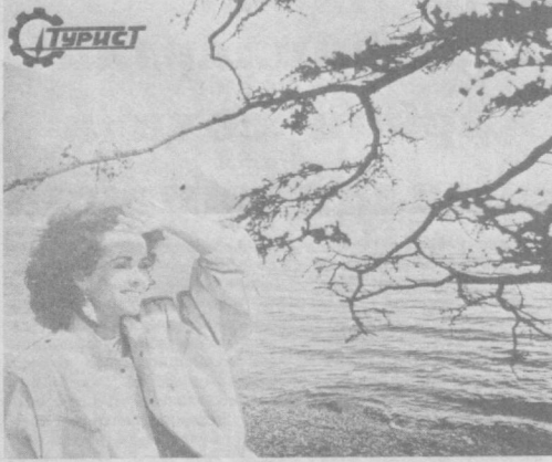
Турист-экскурсия путёвкани реализация қилиш бюроси.

Барча масалалар юзасидан қуйидаги адресга мурожаат қилинг: Тошкент-11, Навоий кўчаси, 69-А, метронинг «Пахтакор» станцияси, телефон 44-12-90.