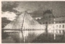
томонидан тарқатилган баёнотда.

Франциядаги Лувр ташриф буюрувчилар сонига кўра, жаҳондаги етакчи музей мақомини сақлаб қолди, дея хабар берди Франс-Пресс агентлиги. Мутасаддиларнинг маълум қилишича, 2011 йилнинг ўзига музейга 8,8 миллионга яқин одам ташриф буюрган. 2008—2010 йиллар давомида эса Париж музейи йилига 8,5 миллион одамни кутиб олган.