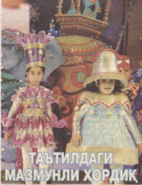
ТАЪТИЛДАГИ МАЗМУНЛИ ҲОРДИК

ўқув йилининг иккинчи ярими учун куч бағишлайди