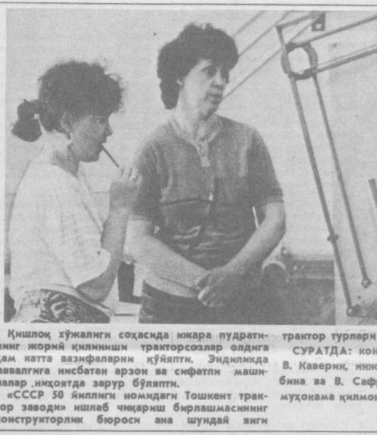
Кишлоқ ҳўжалиги соҳасида иккара пудратининг жорий қилиниши тракторсозлар олдида ҳам катта асосларни қўйяпти. Эндиликда аввалгиларга нисбатан арзон ва сифатли машиналар иқтиёда зарур бўляпти.

© ВАШИНГТОН. Ҳозирги вақтда бутун дунёда жами қуввати 205,699 мегаватт қандайдиган 307 та атом энергетика қурилмаси ишлатилмоқда. Ана шу қурилмалар умумжаҳон электр энергияси истеъмолининг салкам 17 процентини ташкил қилади. Бундан ташқари 101 та реактор қурилмоқда ва яна 110 та сизга буюртма берилган ёки лойиҳалаштирилмоқда.