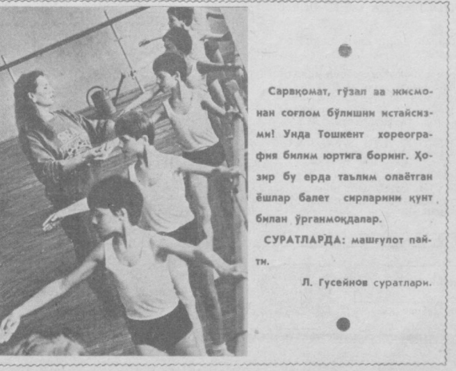
Сарвақомат, гўзал ва жисмонан соғлом бўлишни истайсизми! Унда Тошкент хореография билим юртига боринг. Ҳозир бу ерда таълим олаётган ёшлар балет сирларини кўнгил билан ўрганмоқдалар. СУРАТЛАРДА: машғулот пайти.