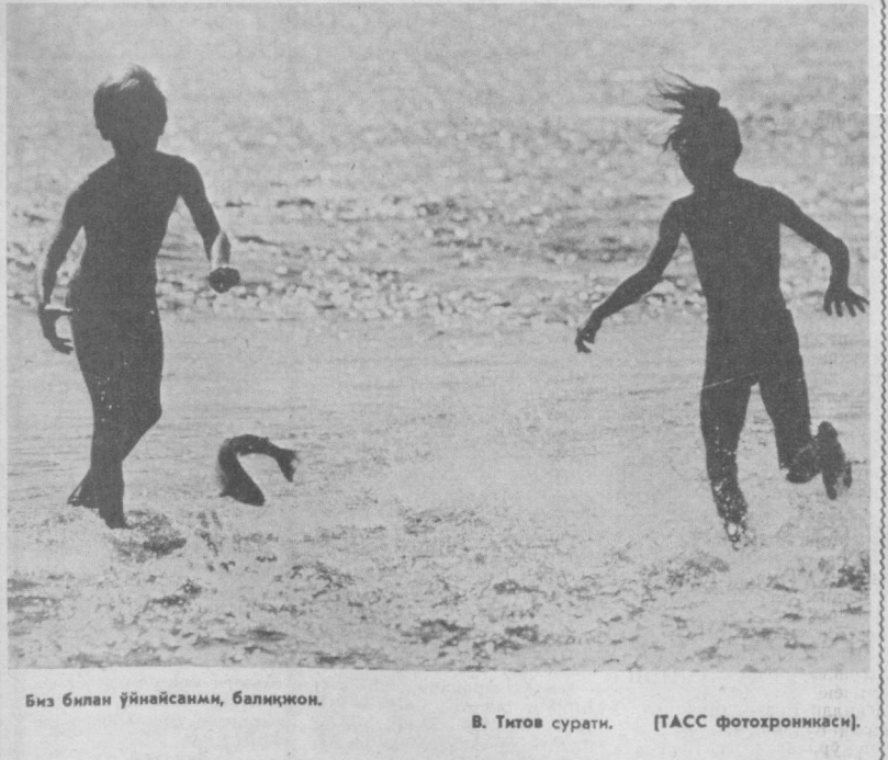
Биз билан ўйнайсаним, балиққон.

— Роза опа сочин чиройли қилиб турмаклар учун бутун санъатини ишга солади.