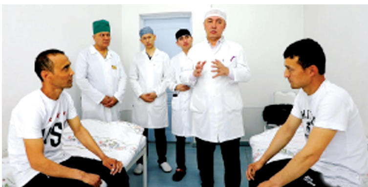
Мазкур операция Андижон шаҳар тиббиёт бирлашмаси жарроҳлик бўлимида Республика ихтисослаштирилган

Ўзбекистонда буйрак кўчириб ўтказиш, жигар ва ўзак хужайра амалиётлари кенгайиб бормоқда. Сўнгги йилларда ана шундай операциялар муваффақиятли бажарилди. Самарқанд, Наманган, Хоразм ва Сурхондарё вилоятларида ўтказилган трансплантация амалиётлари бугун илк бор Андижонда ҳам амалга оширилди.