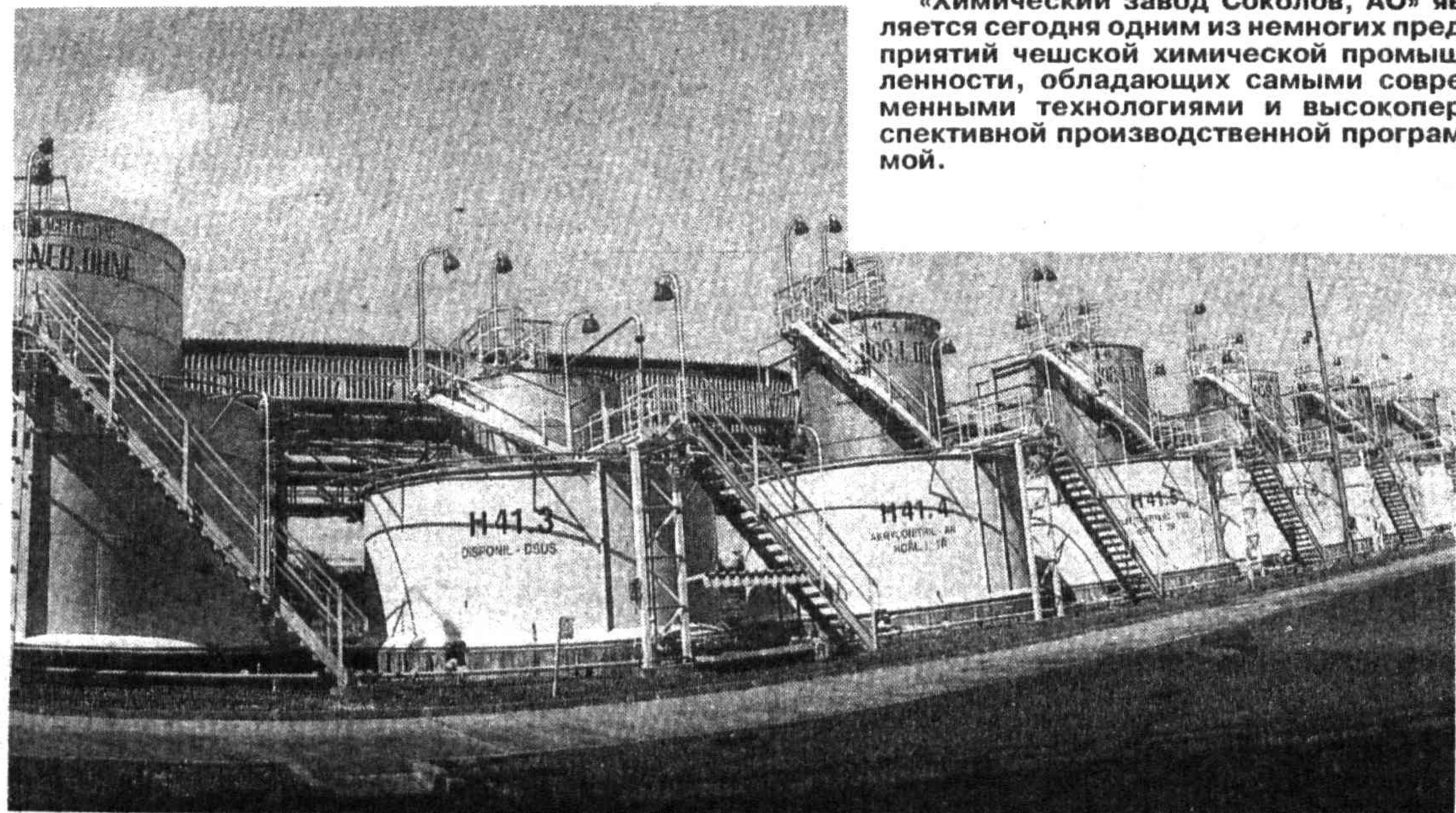
«Химический завод Соколов, АО» является сегодня одним из немногих предприятий чешской химической промышленности, обладающих самыми современными технологиями и высокоперспективной производственной программой.

На выезде из Каира в сторону Александрии есть развилка. Указатель гласит: «В город Шестое октября». Всего несколько минут пути на машине — и на пустынной возвышенности появляются жилые кварталы и фабричные корпуса.