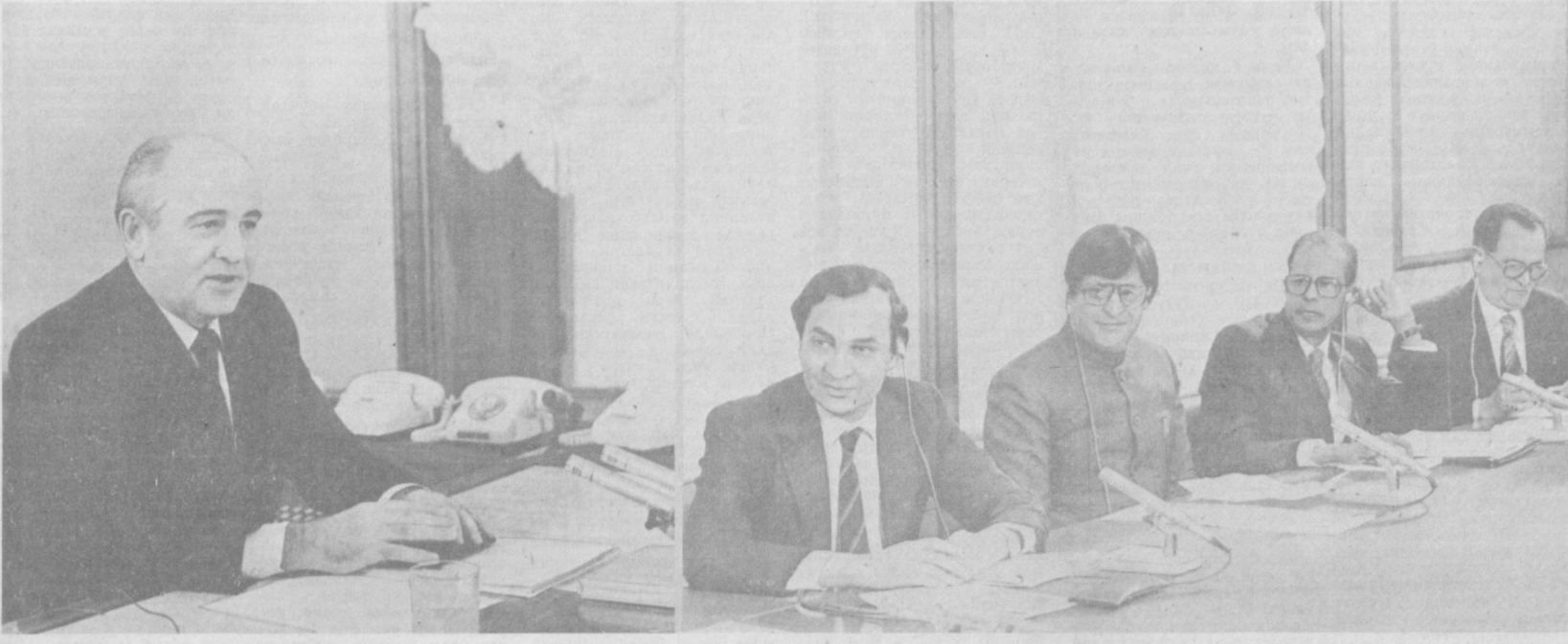
Суратда: М. С. Горбачевнинг ҳинд журналистлари билан суҳбати айти.