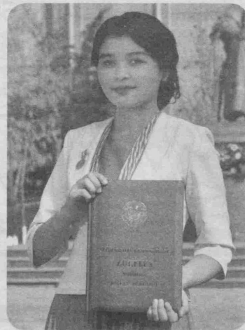
юрт равнақи йўлида хизмат қилишга ҳаракат қиламан.

Зулфияхоним ҳаёти ва маънавияти ҳақида устозларимдан ибратли ҳикоялар эшитганман. Шундай юксак эътирофга сазовор бўлганимдан бахтиёрман. Тенгдошларим ҳар тарафлама ўрнат бўлишга, келгусида