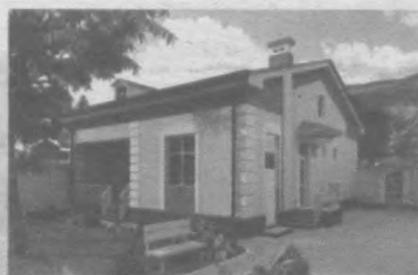
• Янги уйда оилангиз билан бирга фаровон ҳаёт кечиринг.

Оилангиз учун еркин КЕЛАЖАК ЭШИКЛАРИНИ ОЧИНГ!