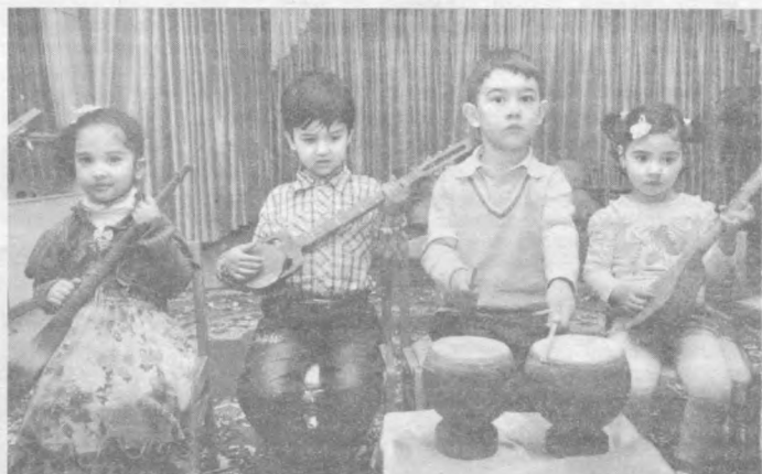
Суратда: пойтахтимиздаги 567-мактабгача таълим муассасаси тарбияланувчилари мусиқа машғулотида.

Албатта, болалар билан ишлашнинг ўзига яраша машаққати бор. Таълим жараёни педагогдан катта