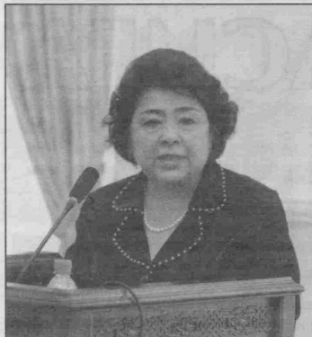
( Давоми. Боши 1-бетда )

Носоғлом муносабатлар, қайнона-келин, эр-хотин ўртасидаги жанжаллар оқибатида оилалар бузилаётгани ҳар биминимизни қаттиқ изтиробга солади.