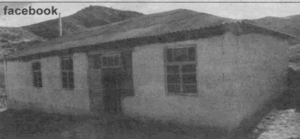
Бойсун туманидаги 16-умумий ўрта таълим мактабининг Г'урхोजи қишлоғидаги филиали (2014-2015 йиллардаги ҳолати)

Шу йилнинг 28 август куни ижтимоий тармоқларда: “Сурхондарё вилояти, Бойсун тумани Г'урхोजи қишлоғи, Чўроб (аслида Шўроб. Тахририят) маҳалласидаги мактаб”, деган изоҳ билан вайрона иморатнинг расми тарқатилди. Суратни кўрган ҳар қандай одам “Мамлакатимиз таълим тизимида улкан ислохотлар жараёни кечаётган бугунги кунда наҳотки шундай харобага айланган мактаблар мавжуд бўлса”, деган фикрга бориши тайин эди. Кўпчилик шундай фикрга борди ҳам.