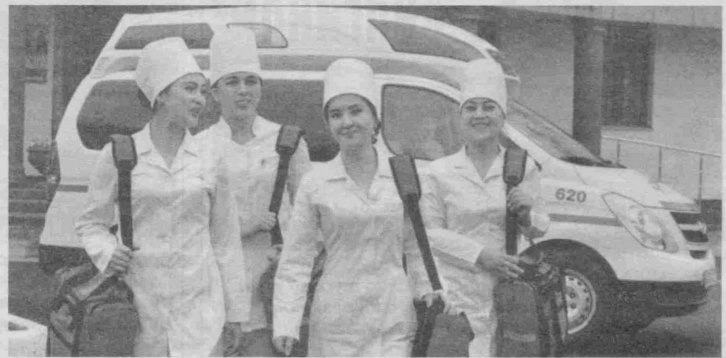
“Тиббиёт ходимлари уйма-уй юриб, касалликларни профилактика қилиши зарур”.

Болалар ўлими ҳолатларининг ўзига хос сабаблари бор. Аҳоли ўртасида тиббий маданиятнинг етарли эмаслиги, ҳамюртларимизнинг ўз саломатлигига эътиборсизлиги масаланинг бир томони бўлса, иккинчи тарафдан патронаж ва стационар тизимдаги ишларимизда ҳам камчиликлар кўп. Она ва бола туғуруқхонадан чиқариб юборилаётганда, бизнинг талабимизга биноан, ўша ҳудуддаги оилавий поликлиника бош шифокорига ахборот берилиши керак. Баъзи бир ҳудудларда оилавий шифокор келиб, ўзи олиб кетмаса, она-болани туғуруқхонадан чиқаришмайди. Бу яхши тажриба. Аммо болалар ўлимини таҳлил қилганимизда, аксарият ҳолатларда, она-бола туғуруқхонадан шундоқ чиқариб юборилаётгани, уйига боргач, оилавий шифокорнинг хабари бўлмай, она, айниқса, бола саломатли-