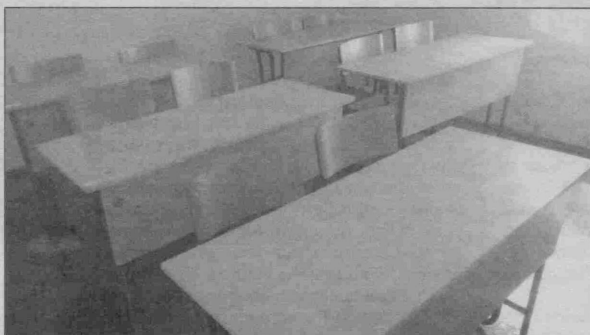
Бойсун туманидаги 16-умумий ўрта таълим мактабининг Г'урхोजи қишлоғидаги филиали (2017 йил 28 августдаги ҳолати)

муассасалари фаолиятини методик таъминлаш ва ташкил этиш бўлими мудири Эшқобил Ғаниев билан бирга Г'урхोजи қишлоғига етиб бордик.