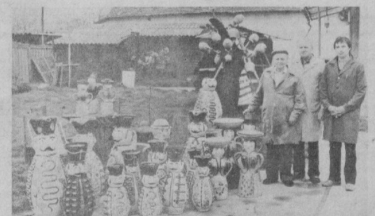
ВХР. Қулоччилик Бюролари Венгрия халқ санъати турларидан бири...