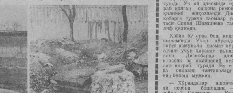
Қурилиш майдонидан бир неча инохуш манзараларни кўриб турибсиз.

Улар 43-АТС қурилиши учун ажратилган маблағни йилдан-йилға ўтказиб берилган. Ҳуқуқсиз, бу ишға ариалашган ҳар бир киши бизда турғулик йилларидан мерос қолган лоқайдлик балосини илдизлари ҳали ҳам мустаҳкам экан дейишляпти. Фақат болаларига хурсанд Чувик қурувчилар қурилиш майдонига ташлаб кетган тракторлар уларға ўйинчоқ вазиёсини ўнатяпти. Вагонлар эса тортишув ва ихтиролар масканига айланган.