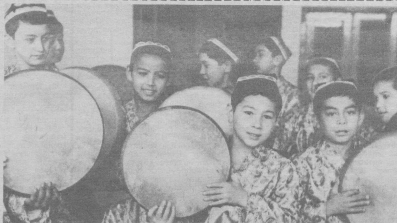
Суратда: Тошкентдаги Островский номи пионерлар саройидаги доирачилар ан-