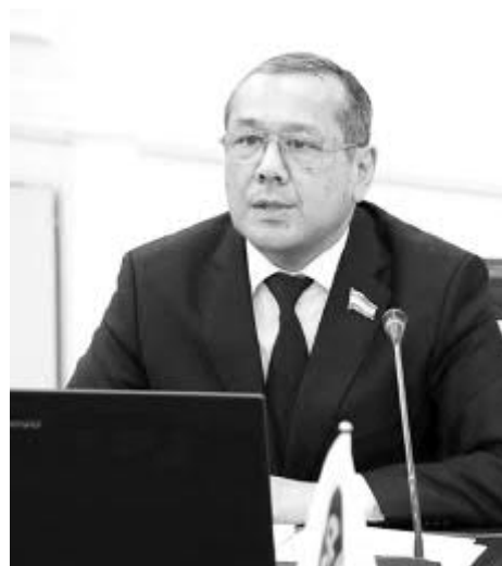
Улуғбек ИНОЯТОВ, ЎзХДП Марказий Кенгаши раиси, Олий Мажлис Қонунчилик палатасидаги партия фракцияси раҳбари:

Унда партия Марказий Кенгаши аъзолари, Олий Мажлис Қонунчилик палатасидаги партия фракцияси аъзолари, ҳудудий партия ташкилотлари