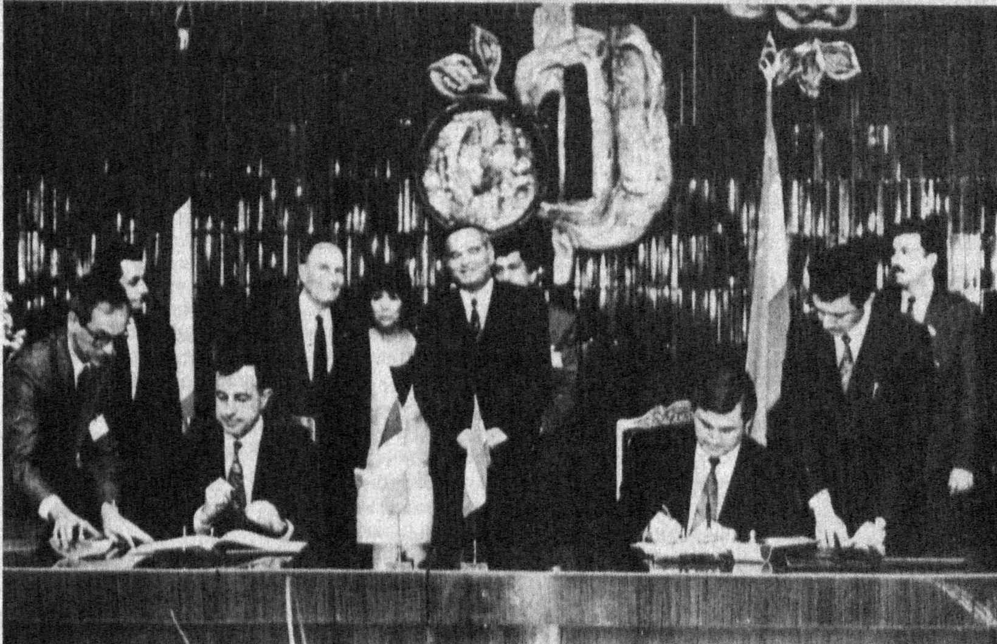
НА СНИМКАХ: во время переговоров; во время подписания документов.

Предметом состоявшейся в ходе встречи беседы с супругами президентов Франции и Узбекистана стали также проблемы языковой подготовки будущих полпредов республики, расширения в этой связи контактов с зарубежными вузами. Госпожа Миттеран рассказала о своем участии в движении Сопротивления, поделилась впечатлениями об Узбекистане, ответила на интересующие студентов вопросы.