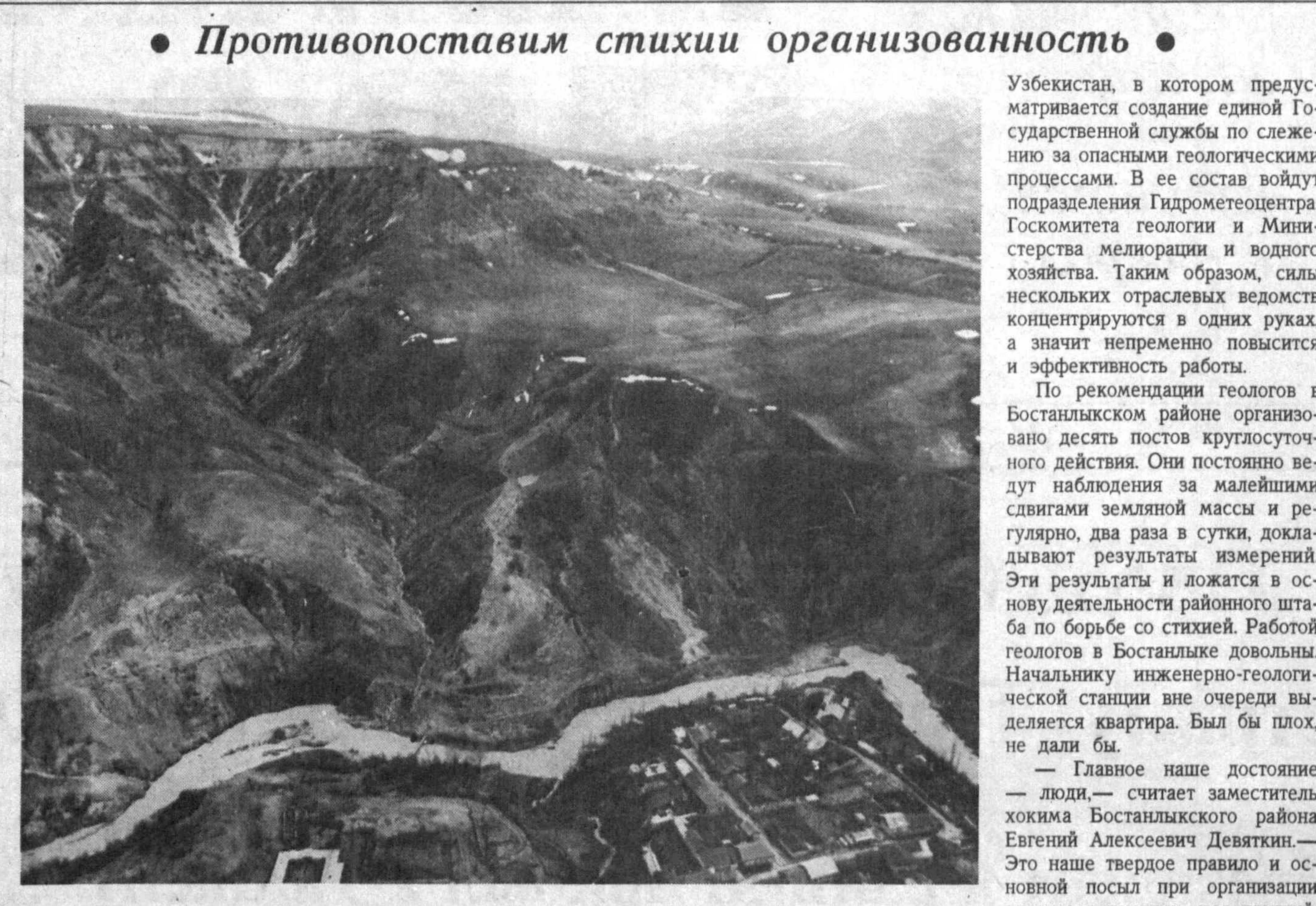
На снимке: оползень на левом берегу Угтама Бостанлыкского района. Снимок любезно предоставлен редакцией сотрудниками экспертно-криминалистического отдела Министерства внутренних дел республики.