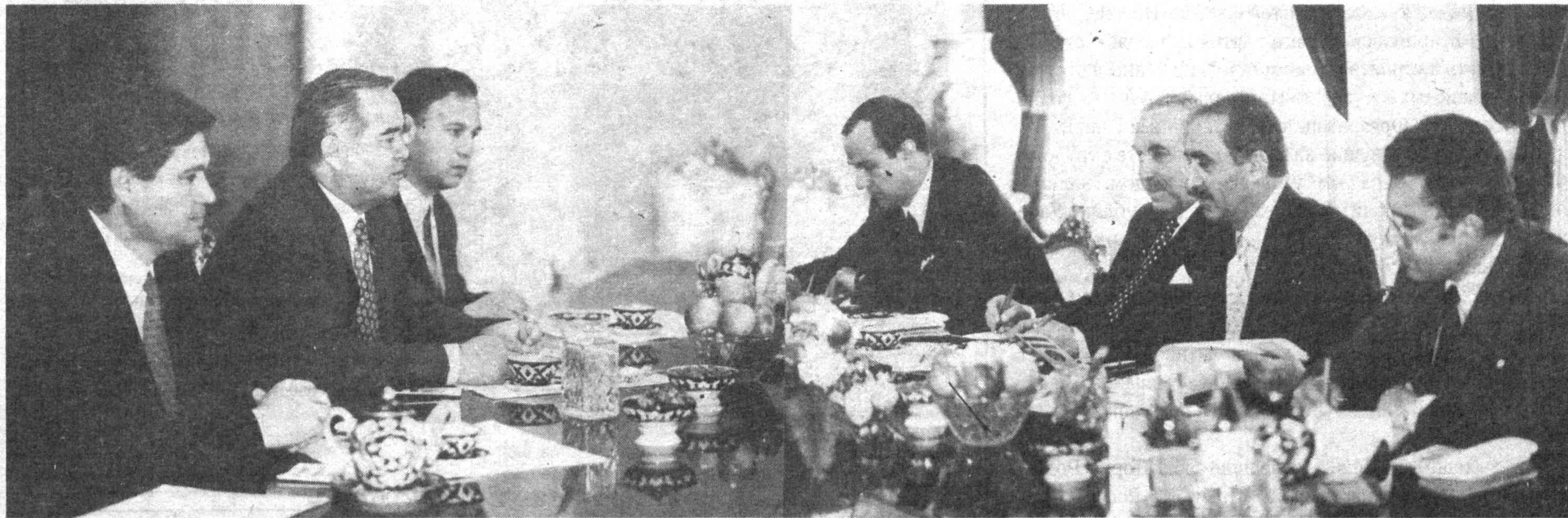
НА СНИМКЕ: во время приема.