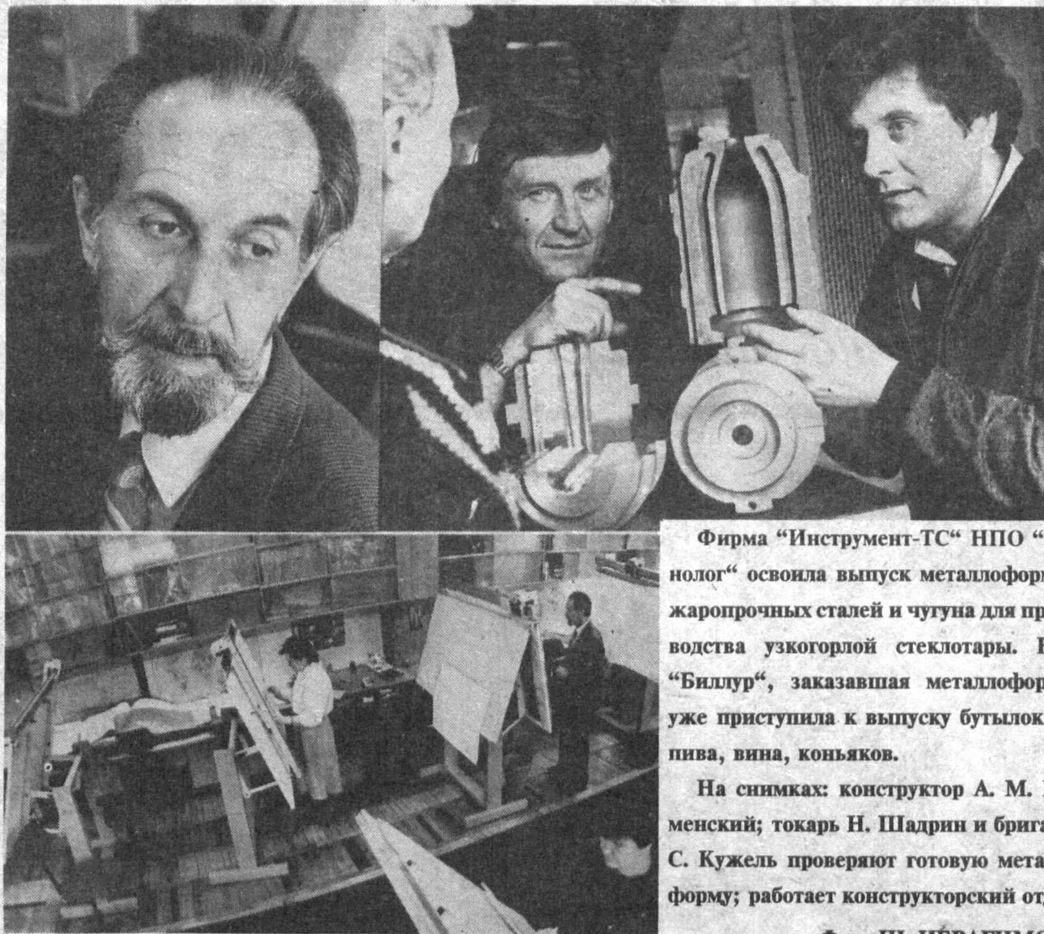
Фирма "Инструмент-ТС" НПО "Технолог" освоила выпуск металлоформ из жаропрочных сталей и чугуна для производства узкогорлой стеклотары. НТФ "Биллур", заказавшая металлоформы, уже приступила к выпуску бутылок для пива, вина, коньяков.