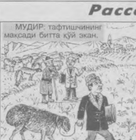
МУДИР: тафтишчининг мақсади битта қўй экан.