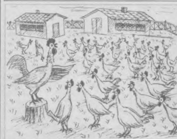
ХҲРОЗ: ҳозир тухумнинг нархи ошди, аммо бизга берилмаётган озуканинг «мазаси» қочди. Шу боис тухум қўйишни тўхтатинглар!

«Фермер» материаллари тахририят Агротехнология йўналишида Республика Деҳқон ва фермер хўжалиқлари уюшмаси ҳамкорлигида тайёрланди.