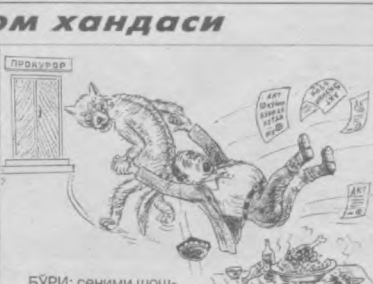
БУРИ: сеними шошмай тур, тухматчи...