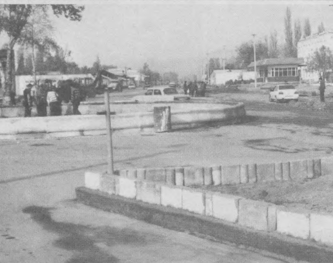
Поп шахрининг марказий кўчаларида иш қизғин. Айникса, Эргаш Ёндош, Ойбек, М.Ҳакимов номи кўчаларини кенгайтириш ишлари тез суръатларда олиб боришмоқда. СУРАТДА: иш жараёни.

Маълумотларга кўра, вилоят божхоначилари ўтган йил