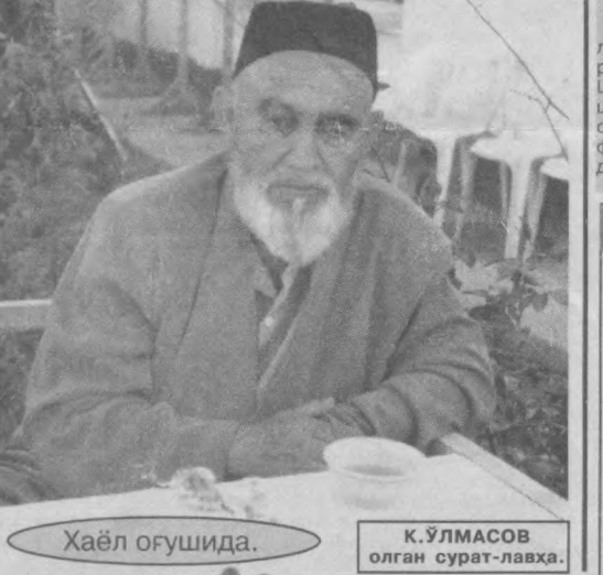
Хаёл оғушида.