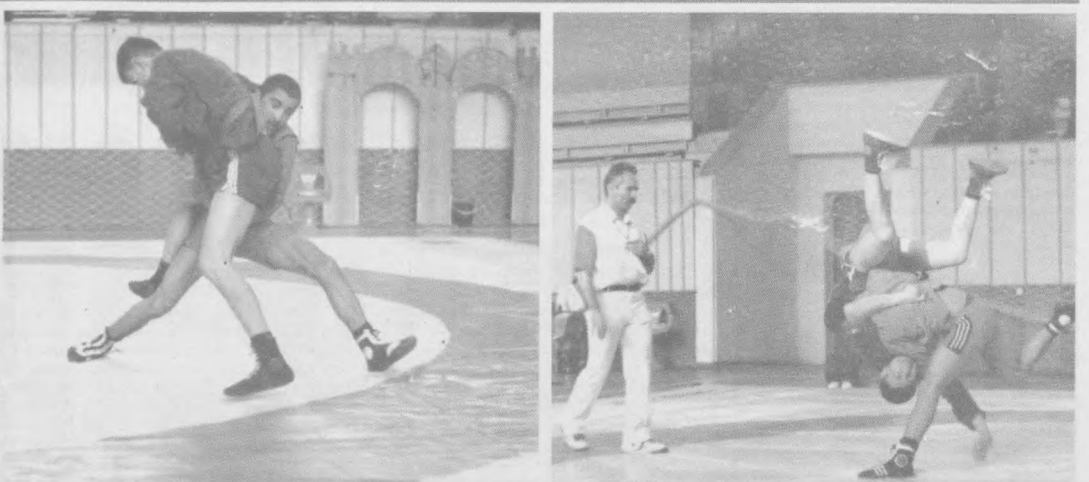
Марказий Ҳарбий Спорт клубида самбо бўйича ёшлар ўртасида Ўзбекистон чемпионати бўлиб ўтди. Унда Наманган ва Қорақалпоғистон Республикаси вакилларидан ташқари барча вилоятлардан 250 нафарга яқин ёш спортчилар иштирок эттишти.