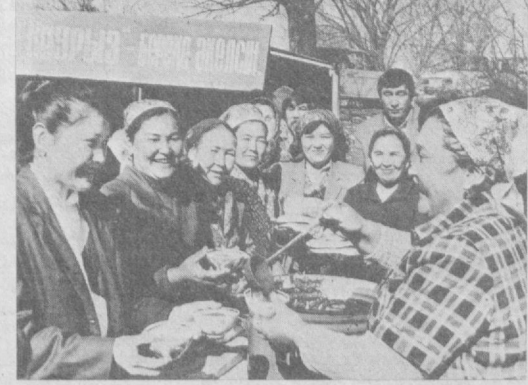
НАВРЎЗ кунларида сумалак ва ҳалим пишириб, бу таниқ таомларни кишиларга улашиш, болалар иштирокида турли завқли ўйинлар ташкил қилиш халқимизнинг азалий удуми ҳисобланади.