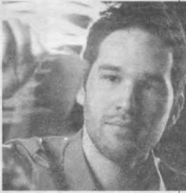
В. ҚАРШИБОВА тайёрлади.

Янги кашфиётга қизиқиш билдирган қатор ишлаб чиқарувчилар "Мўъжизавий мато" иxtiroчилари билан ҳамкорлик қилиш ниятида.