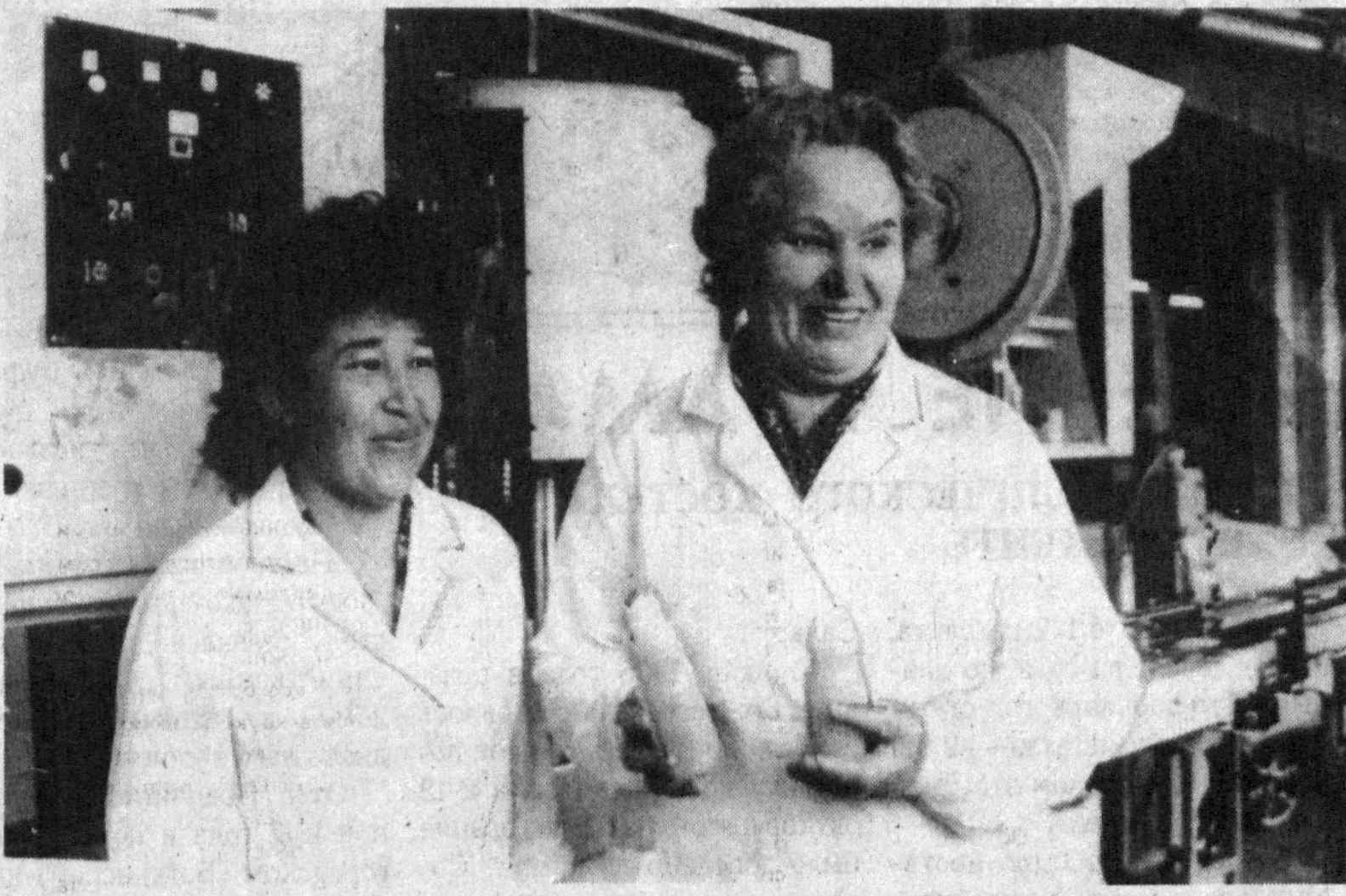
Сложный период переживает ныне коллектив фирмы "Дола". Нарушение экономических связей с предприятиями-поставщиками из ближнего зарубежья...

Ныне дипломы получают более 200 "битовцев". Специализация — самая разнообразная. Это — строительство и эксплуатация зданий и сооружений, технология силикатных тугоплавких неметаллических материалов и изделий.