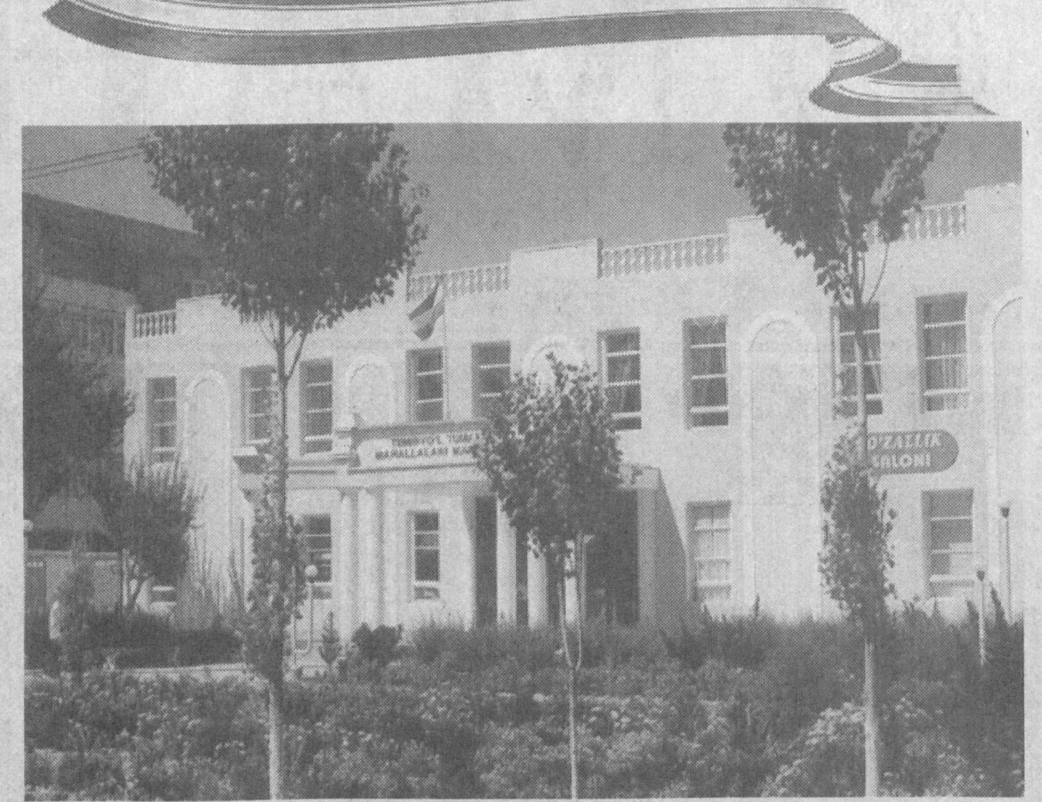
Самарқанд вилояти Темир йўл туманида мустақиллик байрами арафасида «Маҳалла маркази» ишга тушди.