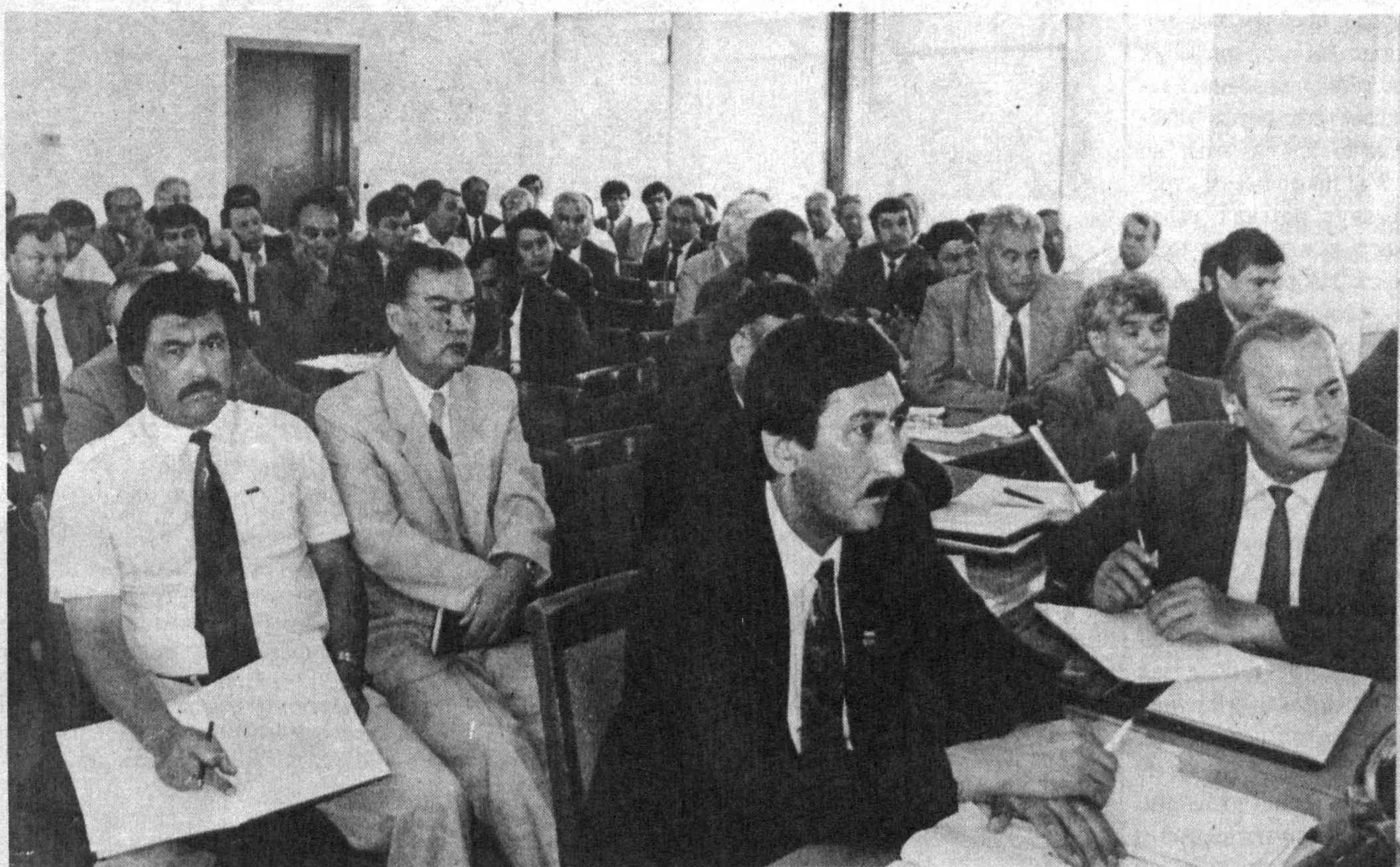
НА СНИМКАХ: на заседании Кабинета Министров выступил И. А. Каримов.

Собрания активов городов и районов продолжаются.