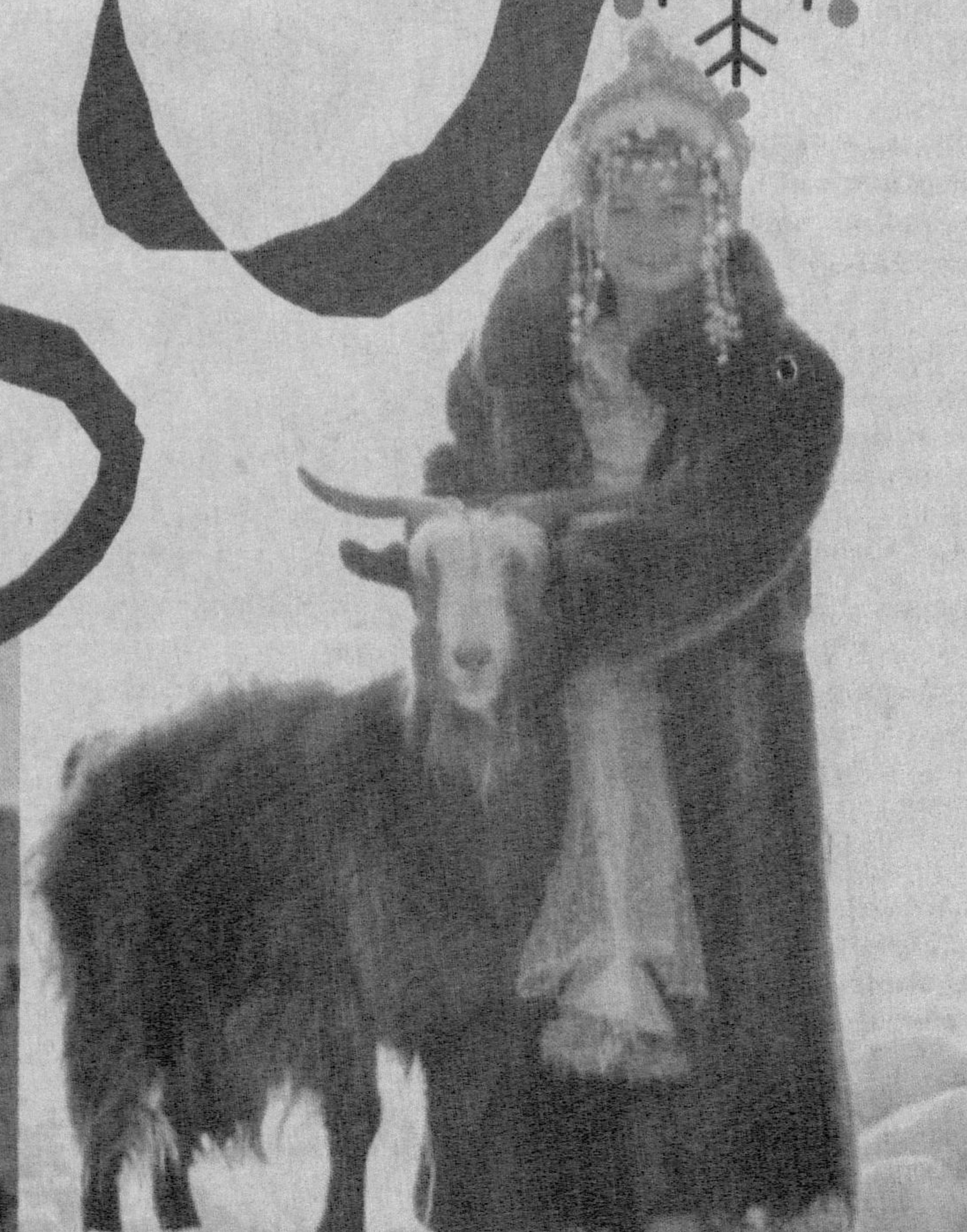
2003 йил - Эчки йили бизга нима- ларни ҳадя қилмоқчи экан?..

Барча ҳамкасбларини кириб келаётган Янги йил билан қутлаб, ошпаларида тинчлик хотиржамлик, ишларида қут- барака тилиб қоладилар!