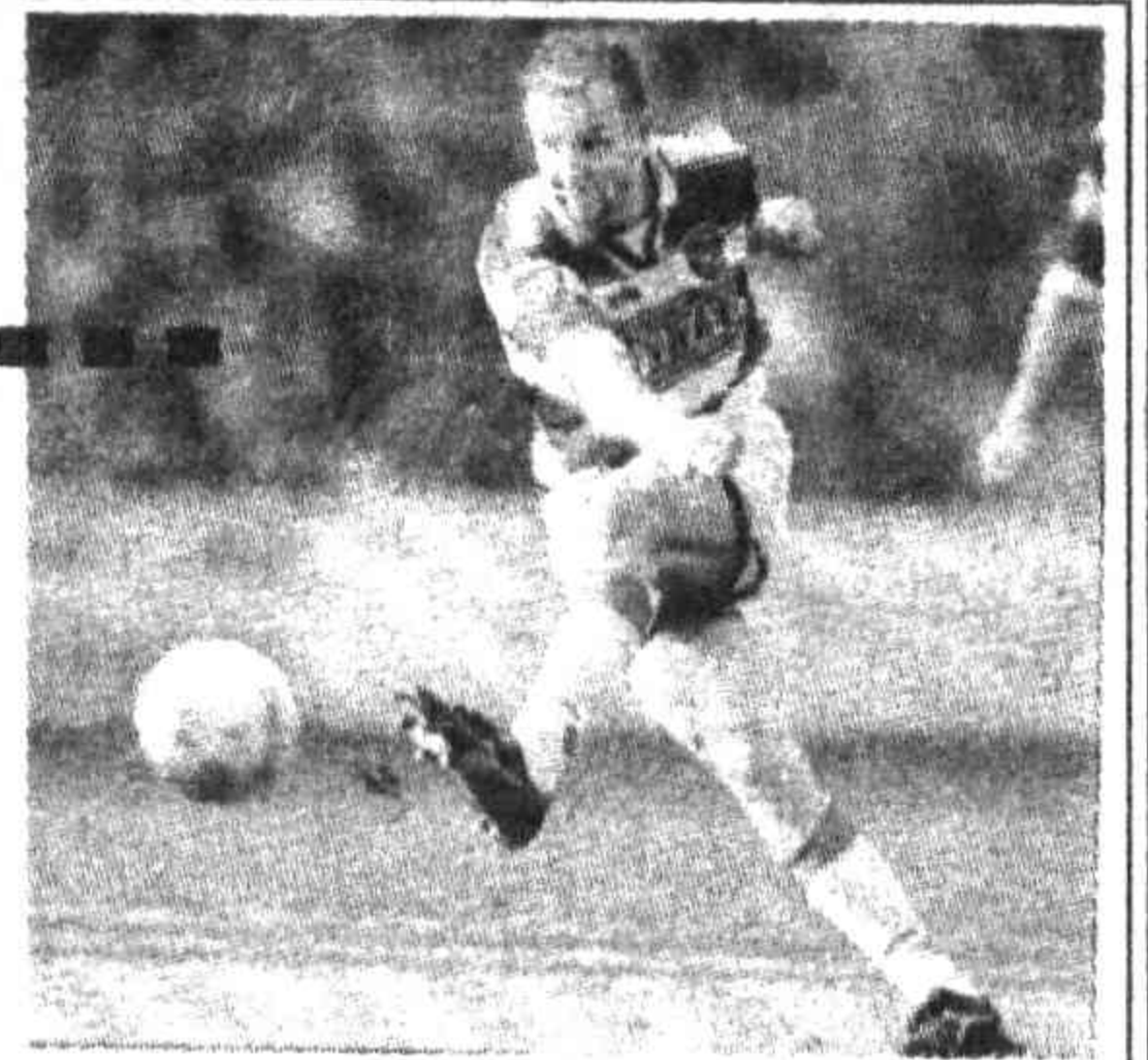
ны лучшими футболистами Узбекистана XX века.

После небольшого перерыва возобновились игры десятого чемпионата страны. В третьем туре «Дустлик» встретился с местным «Сурханом». Напомним: в прошлом году южане были дважды обижены нашими земляками, они уступили в гостях (1:3) и дома (0:1). Так что сурхандарьинцы были полны решимости взять реванш. И это им удалось, хотя и не без труда.