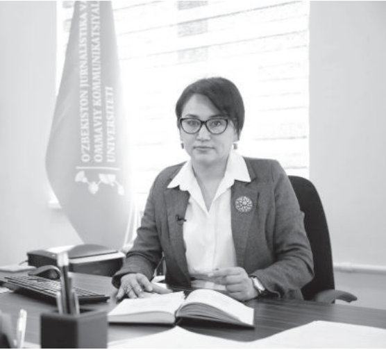
Нозима Муратова. Проректор Университета журналистики и массовых коммуникаций Узбекистана.