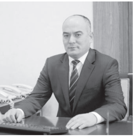
Худаёр Мелиев. Заместитель министра юстиции Республики Узбекистан.