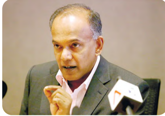
Касивисванатхан ШАНМУГАН, Сингапур Республикаси ички ишлар ва ҳуқуқ вазири:

Адлия вазирлиги Венеция комиссиясининг Ўзбекистондаги энг муҳим стратегик ҳамкорларидан бири бўлиб қолмоқда. 2020-2023 йилларда Марказий Осиё қонун устуворлиги дастури доирасида Венеция комиссияси билан биргаликдаги фаолиятнинг бош мувофиқлаштирувчиси ҳисобланади. Шу муносабат билан Венеция комиссияси Адлия вазирлигидан дастурнинг якунига қадар амалга ошириш учун бир қатор таклифларни ўз ичига олган йўл харитасини қабул қилди ҳамда биз 2022 ва ундан кейинги йилларда ҳам муваффақиятли ҳамкорликни кутмоқдамиз.