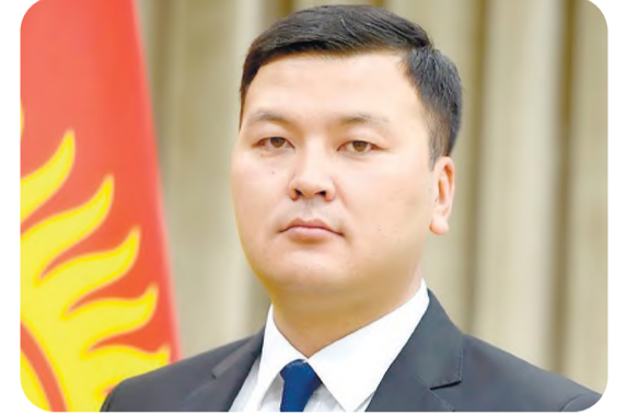
Аяз БАЕТОВ, Қирғизистон Республикаси Адлия вазири, юридик фанлар доктори:

Адлия вазирлигига давомий муваффақиятлар тилайман!