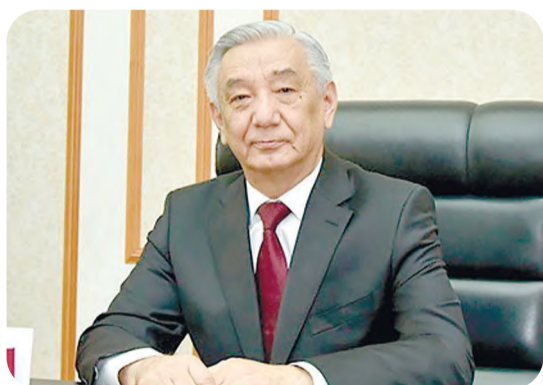
Мирзо-Улуғбек АБДУСАЛОМОВ, Ўзбекистон Республикаси Конституциявий суди раиси:

Фуқароларнинг ҳуқуқ ва манфаатларини ҳимоя қилиш ва юрт фаровонлиги йўлида хизмат қилаётган тизим ходимларининг адолат йўлидаги машаққатли ишларига омад тилайман.