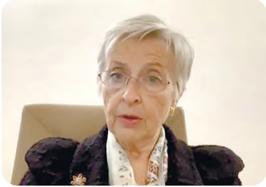
Клер Бейзи-Малаури хоним, Хуқуқ орқали демократия учун Европа Комиссияси (Венеция комиссияси) президенти: