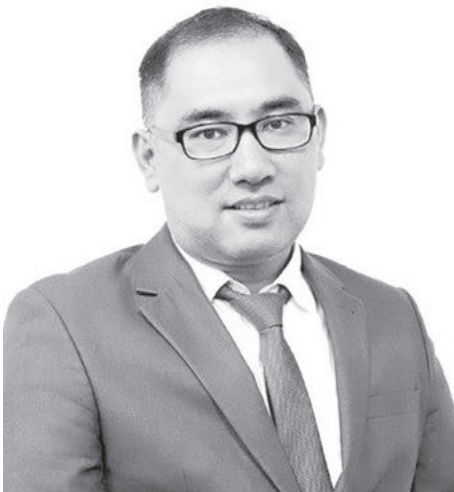
Шахрух Шахматов. Председатель Антимонопольного комитета Республики Узбекистан.