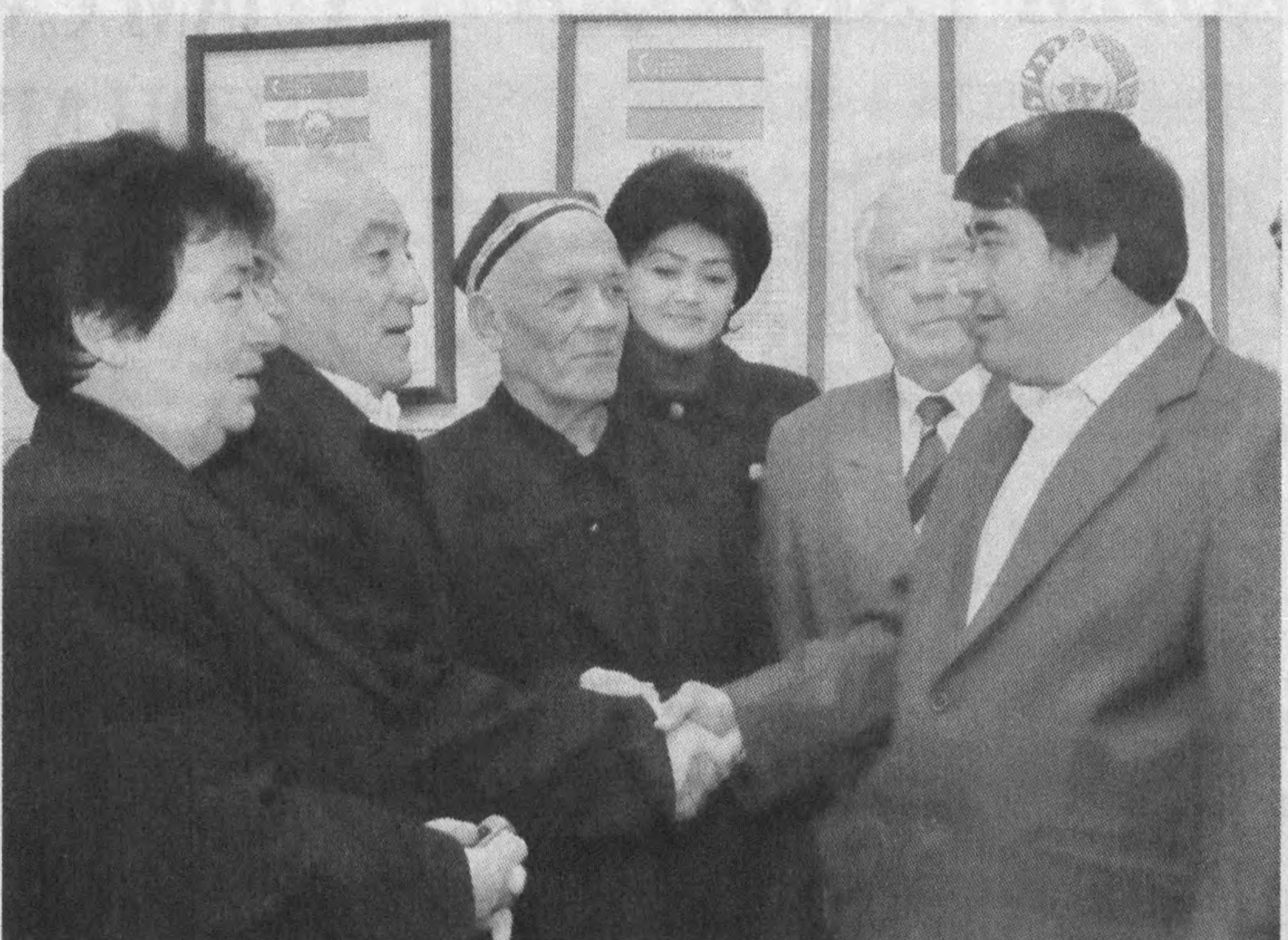
Янгийўл шаҳрида жойлашган «Фарход» маҳалласида фуқаролар йиғини раиси сайлови маҳалладошларнинг ушқоқлиги остида ўтди. Очик овоз бериш йўли билан ўтган сайловда маҳалладошлар тўрт нафар мукобил номзодлар орасида йиғин раиси лавозимига муносиб номзодни сайладилар.

Воҳада сайлов жараёни бошланганига бир ҳафтадан ошди. Сайловни ташкил этиш ҳамда ўтказишга кўмаклашувчи вилоят, туман (шаҳар) комиссиялари томонидан белгиланган тадбирларнинг кўнгилдагидек бажарилиши натижасида жойларда сайловлар ушқоқлик билан, кўтаринки руҳда ўтмоқда. Сайловда йиғин ходимлари фаолиятига таҳлиллик-танқидий нуқтаи назардан баҳо берилиб, мавжуд камчиликлар очик-ойдин муҳокама этилаётгани, номзодларнинг ташкилотчилик ва бошқарувчилик қобилиятига алоҳида урғу берилаётгани ушбу тадбирларнинг ҳаққоний ўғатганидан далолатдир.