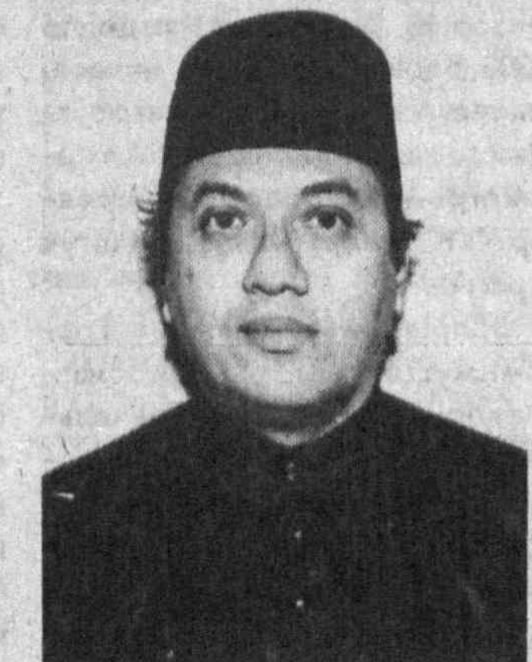
1981 году — советник посольства Малайзии в Эфиопии.

1978 году — 1-й секретарь посольства Малайзии в Вашингтоне (США).