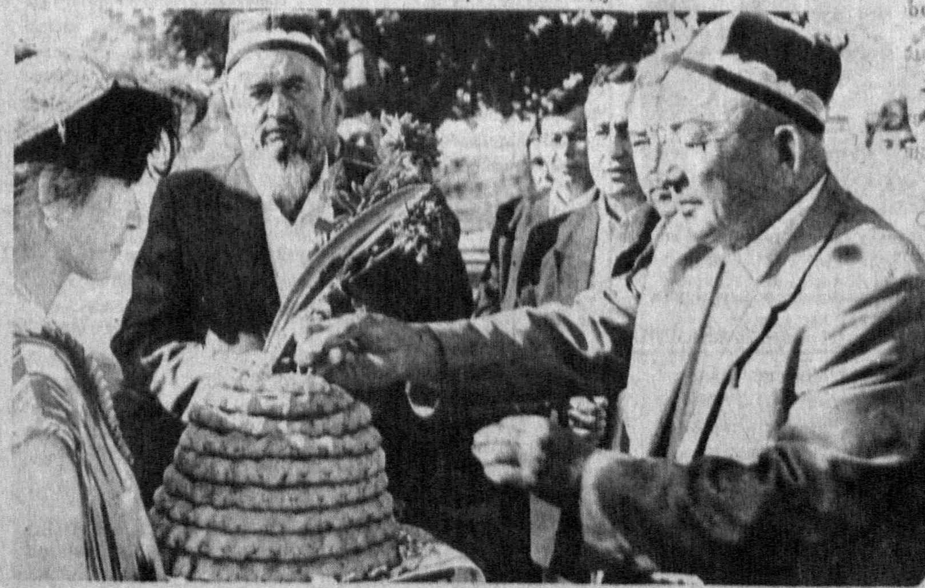
На снимках: встреча хлебом-солью; на хлопковом поле.