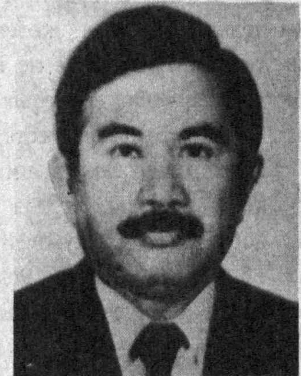
1987 году — начальник Европейского управления Министерства иностранных дел.

1984—1987 году — посол Индонезии в Польше.