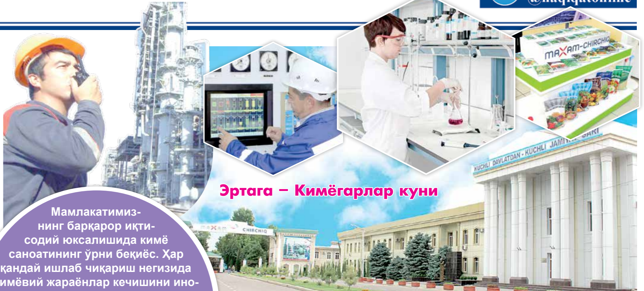
Эртага – Кимёгарлар куни

Мамлакатимиз-нинг барқарор иқти- содий юксалишида кимё саноатининг ўрни беқиёс. Ҳар қандай ишлаб чиқариш негизда кимёвий жараёнлар кечини ино- батга олсак, мазкур соҳасиз иқти- содиётда тараққиёт бўлмаслигини англаб олиш қийин эмас. Дунё ҳам- жамиятида мамлакатимиз салоҳия- тини намойиш этаётган йирик корхоналардан бир «Махам- Chirchiq» АЖ эришаётган ютуқлар фикримизнинг ёрқин далилидир.