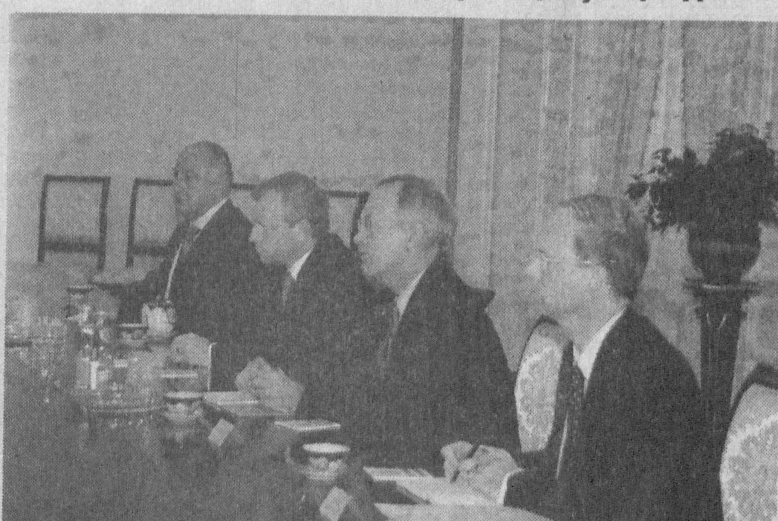
СУРАТДА: қабул пайти.

Суҳбат чоғида юртимизда амалга оширилаётган ислохотлар, жумладан, иқтисодиётдаги ўзгаришлар, нодавлат ташкилотларнинг фаолияти учун яратилаётган кенг шартшароит, оммавий ахборот воситалари эркинлигини таъминлаш, инсон ҳуқуқларини муҳофаза қилишга оид масалалар борасида фикр алмашилди.