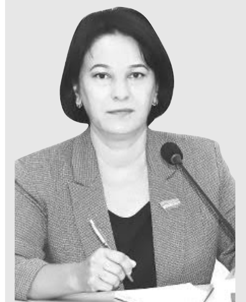
Дилбар МАМАЗОНОВА, Олий Мажлис Қонунчилик палатаси депутаты, ЎзХДП фракцияси аъзоси:

— Ҳар бир соҳада натижага, ўсишга эришиш учун аввал, уни коррупциядан холи қилиш лозим. Ўйлашимча, коррупциянинг олдини олиш, унга қарши кураши чоралари Бош қомусимиздан бошланиши керак.