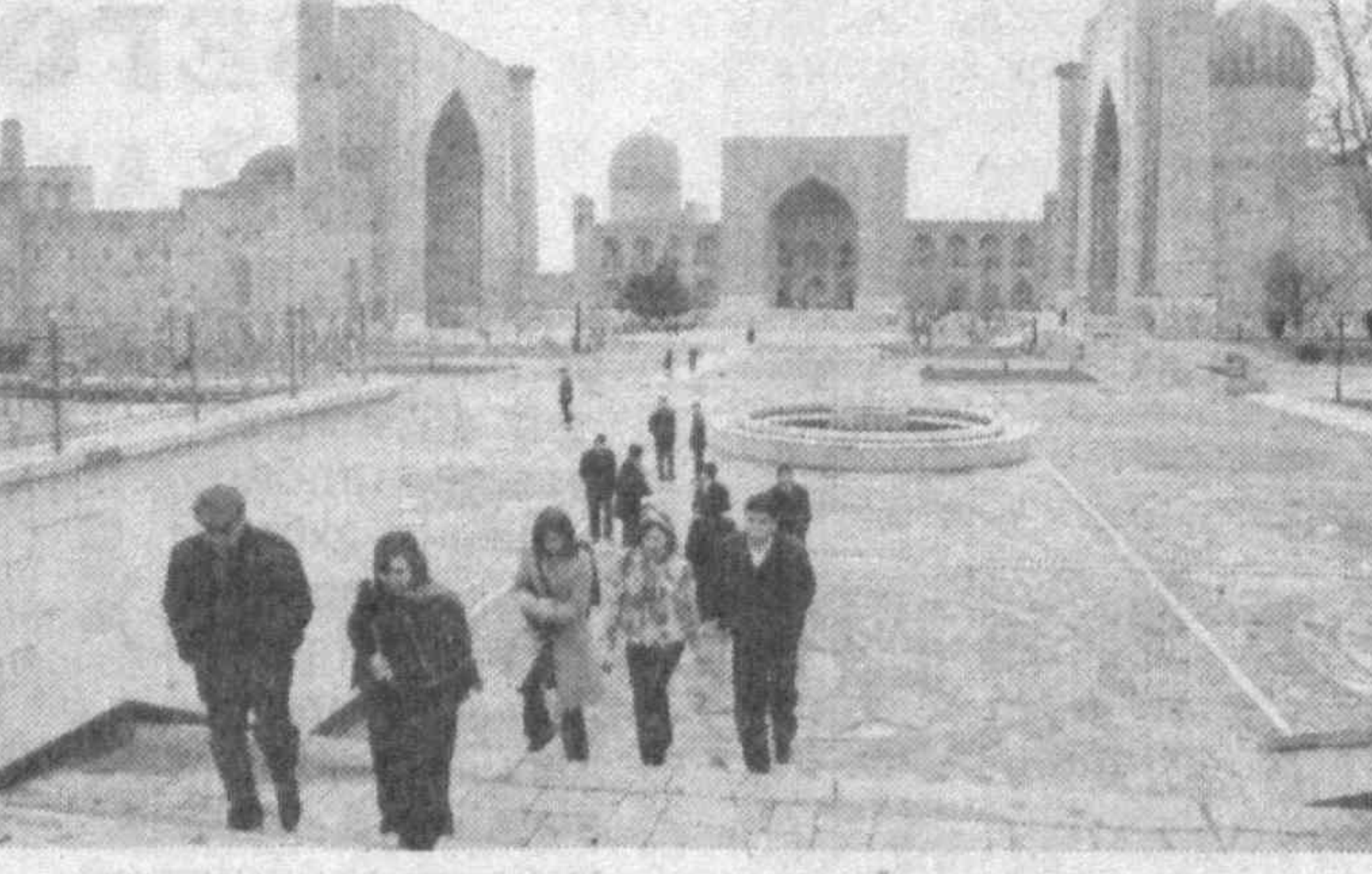
Кўҳна ва ҳаммиша навқирон Самарқанд зиёратчилару сайёҳлар билан доимо гапмуш. Кўни кеча республика Хотин-қизлар кўмитаси ташаббуси билан Тошкент шаҳри, Тошкент ва Сирдарё вилотлари маҳаллаларининг энг фаол ишлашчилари, ибратли оила бекаларидан иборат 250 кишилик махсус гуруҳ ҳам ана шу табарруқ шаҳарда сафарда бўлди.