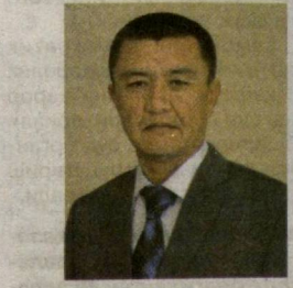
Холмўмин ЁДГОРОВ, Ўзбекистон Республикаси Судьялар олий кенгаши раиси:

Қуйида эътиборингизга тақдим этилаётган давра суҳбатида судьяларнинг бу йилги Мурожаатномада илгар сурилган ғоялар ва унда белгиланган вазифалар борасидаги фикр-мулоҳазалари билан танишасиз.