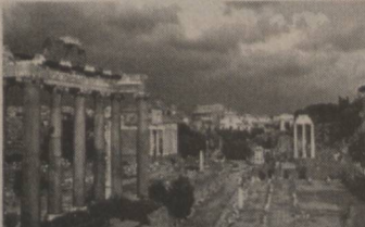
Италия пойтахти Рим маъмурияти ҳукуматдан шаҳарнинг тарихий обидаларини ичкиликбозликдан ҳимоя қилишни талаб этмоқда.

Минтақа иқлимга яхши мослашган ва тез қўпаявчи Осий чигирткаларига қарши қўлланилаётган оддий кимёвий дорилар даярли наф