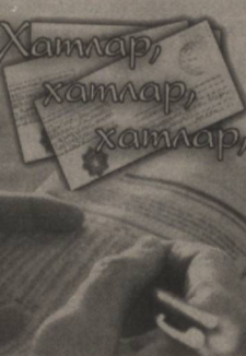
Хатлар, хатлар, хатлар.

Мамлакатимиз иқтисодиёти аграр секторини ташкил этиш тизими йил сайин такомиллашиб, бошқаруving бозор усуллари тобора муқим ва мустаҳкам ўрин топпоқда, қишлоқ хўжалигида иш юритишнинг энг истиқболли ва самарали шакллари ривожланмоқда.