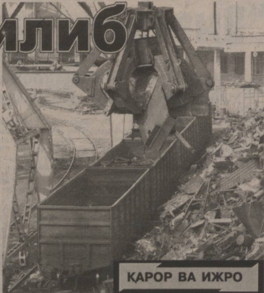
ҚАРОР ВА ИЖРО

Истиқлолнинг дастлабки йилларида фаолиятини қайтадан бошлаган Бекободдаги Ўзбекистон металлургия комбинати ҳозирда тўла қувват билан ишламоқда. Бу жойлардаги иккиламчи қора металл шуьба корхоналарининг доимий тарзда металл парчаларини етказиб беришига боғлиқдир.