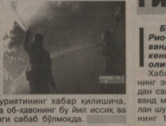
эканлиги маълум қилинмоқда. Ёнғинга қарши минглаб ўт ўчирувчилар ва машиналар жалб этилса-да, оловни чекинтиришни иложи бўлмапти.

АҚШнинг Калифорния штати ҳамон ёнғин қуршовида қолмоқда. Штатнинг асосий ҳудудини ташкил этган ўрмонзорларда келиб чиққан ёнғин 250 дан зиёд тураржой уйлари йўқ қилиб юборган. Олов қуршовида қолган ҳудуднинг кенглиги 1200 гектар (штат майдонининг 30 фоизи)