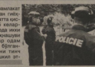
Жаҳон матбуоти хабарлари асосида Ш.САНАЕВ тайёрлади.

Бразилия полицияси Рио-де-Жанейрода гиёҳвандфурӯшларга қарши кенг қамровли амалиёт оғди борди. Хабарларга кўра, шаҳарнинг энг хавфли туманларидан саналган Алемоада гиёҳванд моддалари савдоси билан шуғуллануви йирик гуруҳнинг 12 нафар аъзоси йўқ