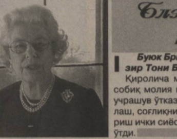
Буюк Британия қиролиҳис Элизавета II бош вазир Тони Блэр истаъфосини қабул қилди.

Хабарларга кўра, шаҳарнинг энг хавфли туманларидан саналган Алемоада гиёҳванд моддалари савдоси билан шуғуллануви йирик гуруҳнинг 12 нафар аъзоси йўқ