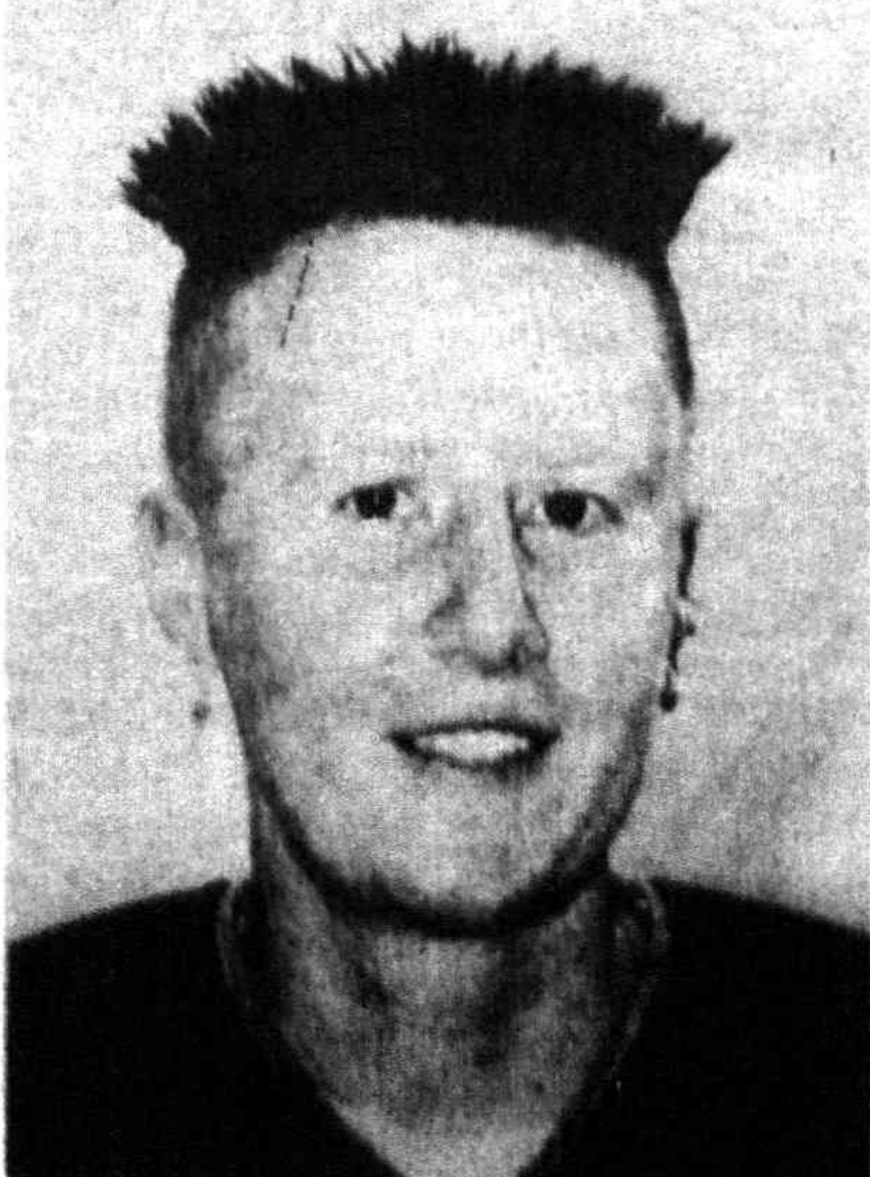
Лицо сегодняшней «коммунистки» — депутат Ангела Меркель от ПДС

Депутаты парламента имеют огромные права, даже неожиданные — при осмотре здания нам разрешили понаблюдать за ходом заседания Бундестага. Рядом с нами было много других людей. Мы поинтересовались: кто они?