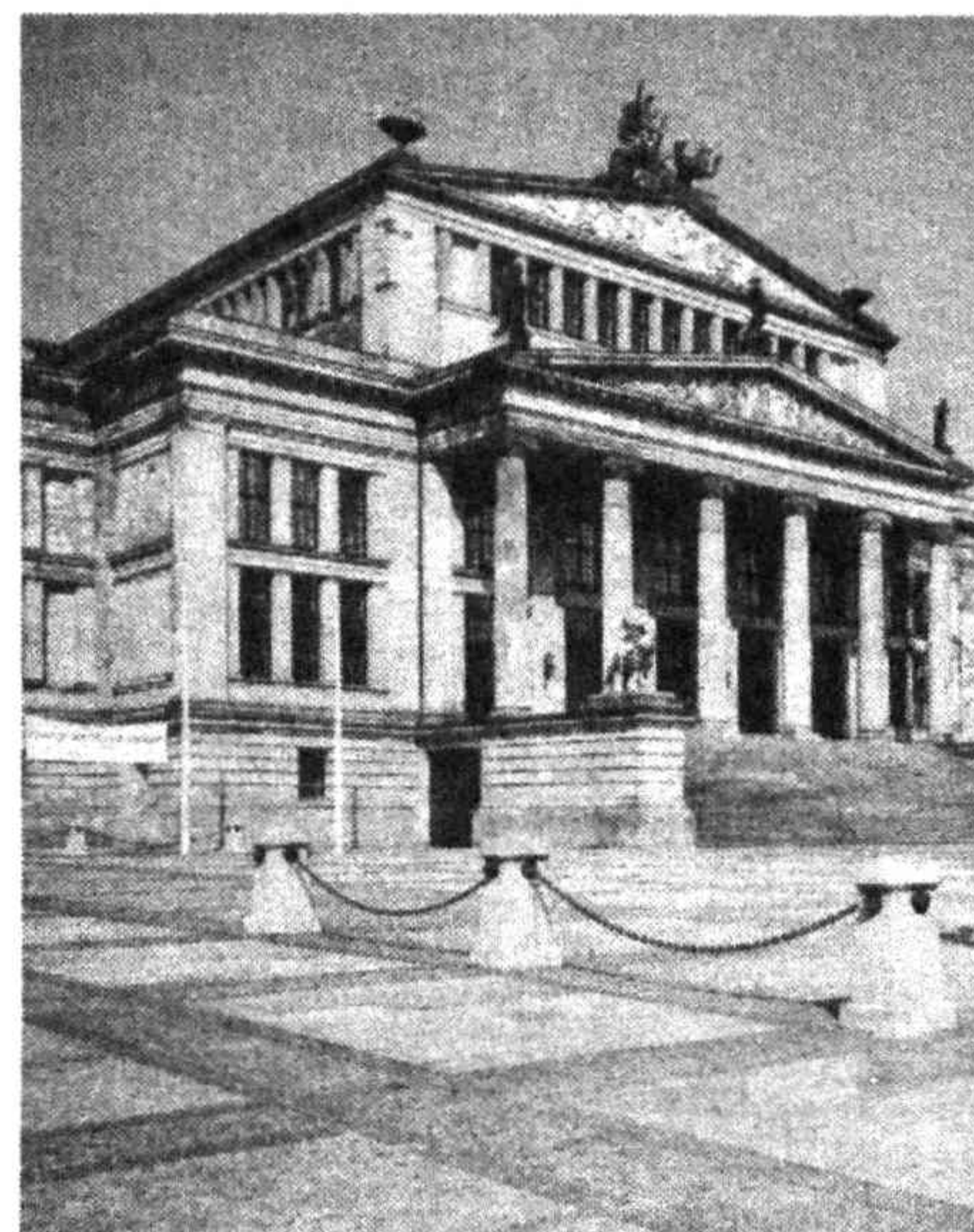
На площади Жандарменмаркт

Мне надо писать покороче и не обязательно обо всем — ведь впереди еще