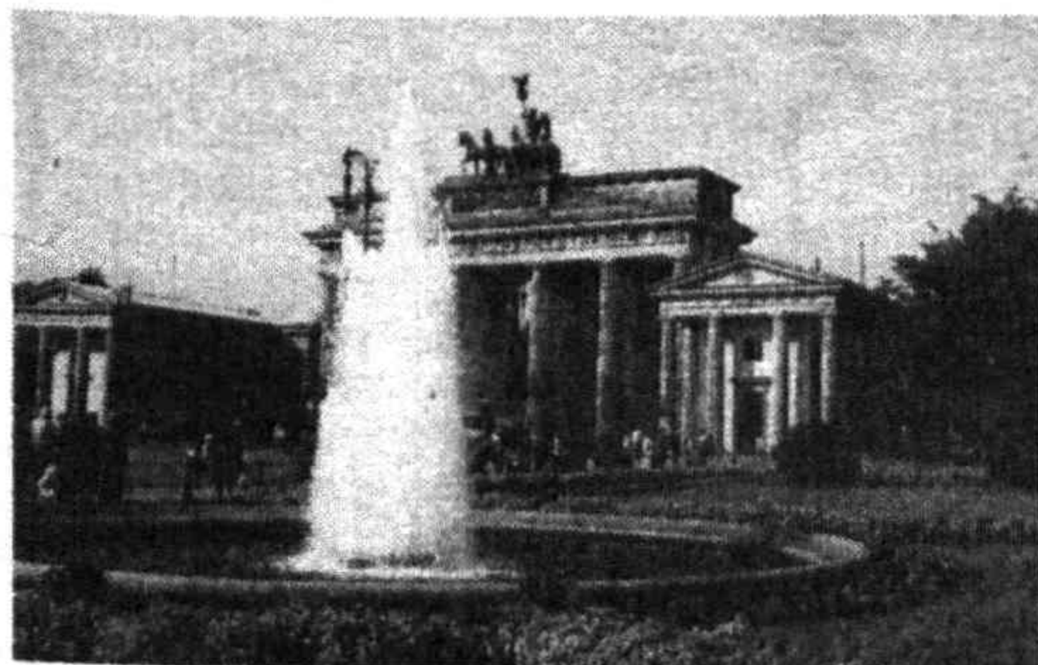
Бранденбургские ворота: символ германского единства

В 1978 г. я, находясь в отпуске, побывал в нем, но только в восточной части, западная же была огорожена каменной стеной. У этого большого старинного города очень непростая судьба. Любопытно, что первое письменное упоминание о городке Кёльн — так тогда называлось это место — появилось в 1237 г. Очень быстро из рыбацкой деревушки